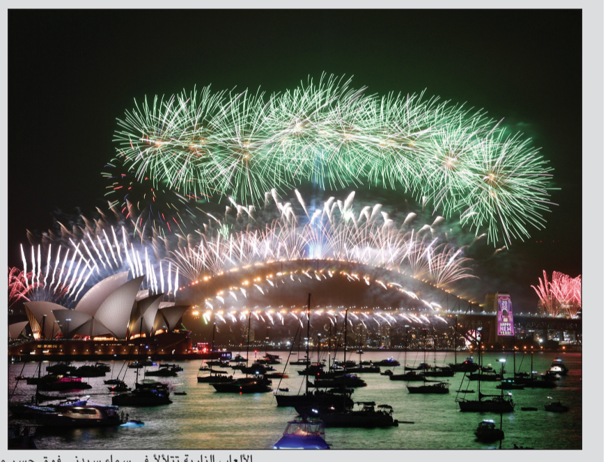
الألعاب النارية تتلألأ في سماء سيدني فوق جسر ميناء المدينة ودار الأوبرا