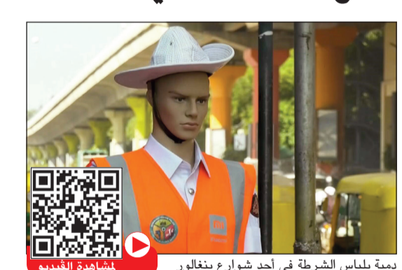
دمية بلباس الشرطة في أحد شوارع بنغالور

بنغالور (الهند) - أ.ف.ب: تبنت السلطات في مدينة بنغالور جنوب الهند طريقة غير عادية لمنع المخالفين من خرق قانون المرور وهي وضع عناصر شرطة من الدمى. وتوضع هذه الدمى التي تلبس ملابس خاصة بشروطي المرور، من قبعات وقمصاناً بيضاء وسترات مشعة مع شارات، عند التقاطعات الرئيسية على أمل أن تدفع السائقين إلى احترام قوانين السير، مع وجود 8 ملايين سيارة تسير على الطرق المزدحمة في بنغالور، حيث تقول الشرطة إنها لا تملك ما يكفي من العناصر البشرية لإدارة كل التقاطعات.