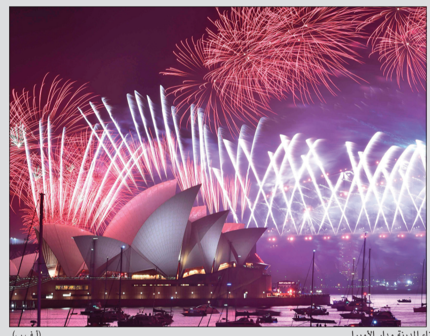
الألعاب النارية تتلألأ في سماء سيدني فوق جسر ميناء المدينة ودار الأوبرا