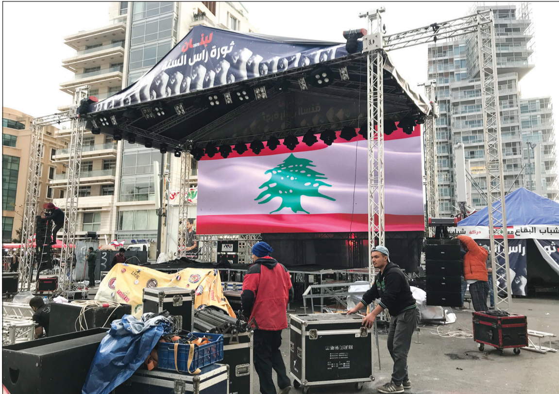
منظومون في الحراك الشعبي خلال تحضيرات منصة الاحتفال الفني المجاني تحت عنوان ثورة رأس السنة

والاعتبار أن «الفوضى التي حكمت البلاد في العقود الثلاثة الأخيرة أنتجت الانفجار الذي يحصل اليوم، بسبب عدم قدرة الناس على تحمل المزيد». وقال عون «إذا بقيت الأزمة على حالها والمواطنون على احتجاجهم دون فسحة من الهواء، فستتفاقم الأزمة عما هي عليه اليوم، لأن النزول الدائم إلى الشارع وإقفال الطرقات يعطل ما تبقى من إنتاج لدينا». الناخب القواني السابق له وجهة نظر مغايرة لما جرى ويجري، فقد رفض انطوان زهرا القول أن موقف القوات اللبنانية هو الذي دفع الحريري إلى الاعتذار عن عدم تشكيل الحكومة، بل الشروط التعجيزية التي وضعت امامه، وقال لقناة «الجديد»: نحن في حالة أفلاس بسبب القليعة مع العالم العربي بسبب اجراءاتنا، وإذا وفق حسان دياب في تشكيل الحكومة فلن تستمر 3 او 4 أشهر، وبالتالي هذا الوضع سيؤدي للحريري إلى الحكومة على حضان أبيض. نهاية السنة كانت للحراك السوري، الذي نظم سهره حاشدة في ساحة الشهداء ضمن برنامج فني مجاني، يحية من تصافف بقاؤهم من أهل الغناء الذي اختار كبارهم السهر في العواصم الأخرى. وقد اتخذت القوى الامنية الاحتجاجات اللازمة واقامت حواجز لفحص نسبة الكحول في الدم لدى السائقين.