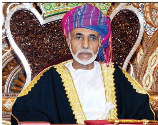
السلطان قابوس بن سعيد

مسقط - أوننا: ذكر التلفزيون العماني، نقلاً عن بيان للبلاط السلطاني، أن السلطان قابوس بن سعيد في «حال مستقر» ويتابع برنامج العلاج المقرر». وجاء في البيان، بتشرف ديوان البلاط السلطاني بإفادة أبناء الوطن العزيز بأن السلطان قابوس بن سعيد يتابع برنامج العلاج المقرر، وأنه في حال مستقر ولله الحمد والشكر داعين الله، سبحانه وتعالى، أن يمن عليه بمزيد من التحسن، وصولاً إلى النتائج المرجوة، إنه جل في علاه ولي ذلك والقادر عليه.