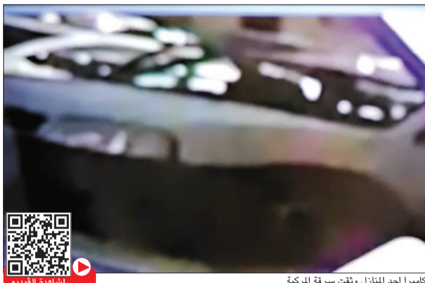
كاميرا احد المنازل وثقت سرقة المركبة

ذكرت ادارة العلاقات العامة والإعلام بالإدارة العامة للإطفاء في بيان لها أمس الثلاثاء بعد تداول مقطع فيديو بين عدم وجود أي موظف في ادارة الوقاية التابعة لبرج التحرير عن اتخاذ قرار بإحالة الموظفين للتحقيق والقيام بنقلهم