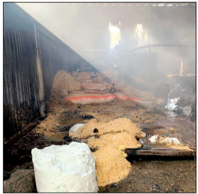
الحريق اتى على كمية من العلف داخل المخزن