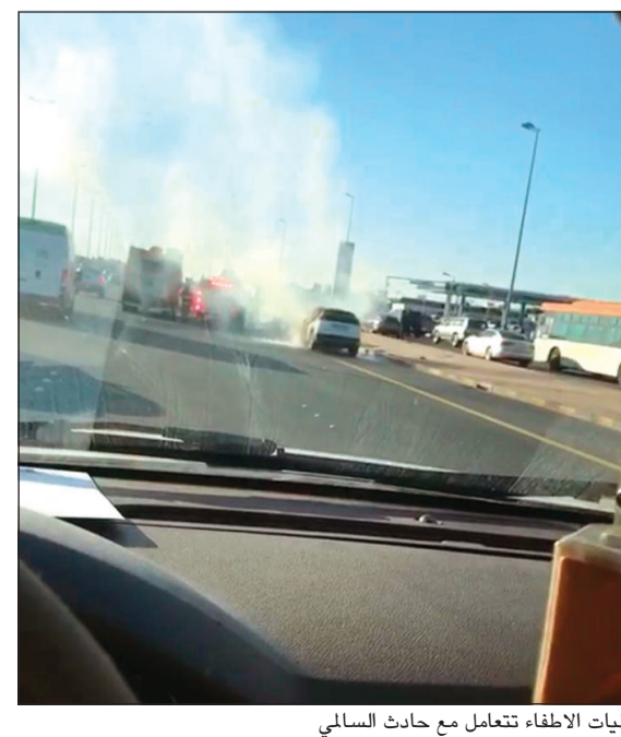
آليات الإطفاء تتعامل مع حادث السالمي