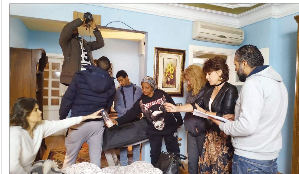
أنوشكا ويسرا والاستعداد لتصوير مشاهدهما