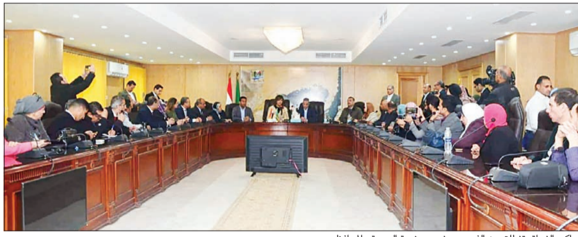
مراكب النجاة تنطلق من الفيوم بحضور وزيرة الهجرة والمهاجرين

إنجاح مبادرة «مراكب النجاة» بالتعاون مع وزارة الهجرة، من خلال العمل على التوعية بمخاطر الهجرة غير الشرعية بشكل «ممنهج» ومدروس، والبحث عن فرص آمنة للعمل بالداخل في المشروعات القومية العملاقة، في إطار خطة الدولة لتوفير فرص عمل والقضاء على البطالة وتحقيق التنمية المستدامة.