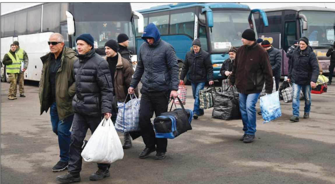
التفويضات الأوكرانية لروسيا خلال عملية تبادل الأسرى مع أوكرانيا

من الطرفين قد توجهوا إلى ما يسمى «المنطقة الرمادية» الفاصلة بين مواقع طرفي النزاع لإتمام عملية التبادل، لافتة إلى أن الحكومة الأوكرانية قدمت ضمانات لوكالة الطاقة النووية الأوكرانية.