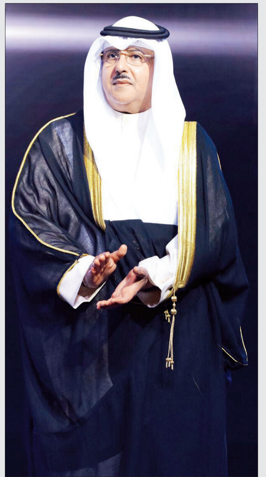
الوكيل المساعد لقطاع الإذاعة الشيخ فهد المبارك الصباح