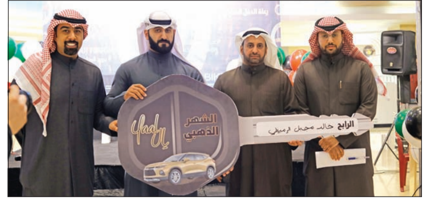
إدارة المجمع وممثلو وزارة التجارة خلال السحب على الجائزة الكبرى سيارة بليزر

قال تقرير «الشال» الاقتصادي إن جهود «هيئة أسواق المال» و«البورصة» و«المقاصة» واصلت تحقيق نجاح متصل في توفيق أوضاعها وفق متطلبات الأسواق الناشئة، وتم ترقية بورصة الكويت إلى مضاف تلك الأسواق، سابقا على مؤشري «FTSE Russell» و«Standard & Poor's» وحدثت على مؤشر MSCI. وبحلول مايو 2020 سوف تستقبل البورصة استثمارات غير مباشرة جديدة بحدود 3,5 مليارات دولار. وأشار التقرير إلى أن الأهمية ليست للمبلغ المحتمل استثماره في البورصة، فالمبلغ لا يتعدى 2,94% من قيمتها الرأسمالية الحالية، كما وليس لدى الكويت شح في مستثمرين يملكون فائض سيولة، الأهمية تأتي من الارتقاء بمستوى التنظيم والشفافية، وتأتي من دعم مستوى ثقة ظل لفترة طويلة مفقود منذ أزمة 2008 وحتى أولى ترقبات البورصة. وذكر التقرير أن الحاجة إلى الثقة ليست لشركات السوق الأولى التي تمتع بمستوى ثقة