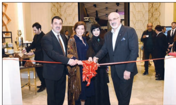
خلال قص شريط افتتاح المعرض

شارك عدد من منظمات المجتمع المدني، وهي «إيثار» ضد تعنيف المرأة، و«النوير» لمؤسستها الشبيخة أنتصار سالم العلي لتعزير التفكير والتعامل الإيجابي في الحياة، و«اسباب» لمؤسستها الشبيخة ماجدة الصباح للتوعية بالأمراض النفسية وأعراضها ومخاطرها وسبل تجاوزها والشفاء منها، وأخيرا «Spread the passion - the art of living» الموسوي المعنية بتشجيع الشباب على الانخراط في الأعمال التطوعية والخدمية للمجتمع، شاركت في معرض passions Arabia والذي يهتم بالشفغ العربي في مجالات الفن والجمال وتصميم الأزياء، وتضمن المعرض في نسخته الأولى، والذي نظمته شركة بي إتش سفن (PH7) تحت رعاية بنك الخليج وشركة علي الخانم وروز رويس، مشاركة 25 مصمما ومصممة من الموهوبين العرب والذين لهم بصمات عالمية مميزة في مجالات الفن والجمال وتصميم الأزياء والحلي والأحذية والحقائب والإكسسوارات المنزلية من الكويت والسعودية ولبنان ومصر والمغرب.