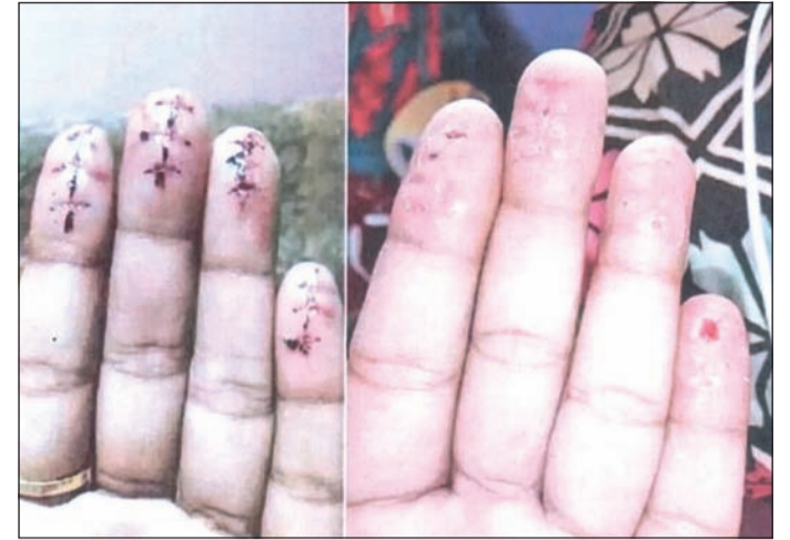
صور لكفوف وافدين تم ضبطهم من قبل مباحث الإقامة وقد شوهوا أصابعهم بقصد الدخول إلى البلاد