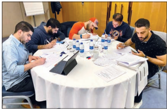
جانب من المشاركين في البرنامج التدريبي