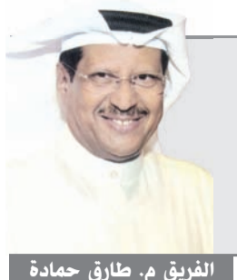
الفريق م. طارق حمادة

جديد، حينما تصدر عن الداخلية تعليمات بعينها وتدعو إلى الالتزام بها سواء فيما يتعلق بإغلاق طرق وغير ذلك فإنها تريد السلامة للجميع وتفسد أي محاولات للإخلال بالأمن، من الواجب والحتمي علينا التعاون مع رجال الأمن والإدراك بأن وجودهم لحمايتنا، وأن يتم تجنب الممارسات غير القانونية والالتزام بقرار مجلس الوزراء رقم 900 لسنة 2009 والذي يمنع استعمال البانشيات والبقيات على الطرق الرئيسية والسريعة والمعبد والأحياء السكنية والمناطق الداخلية والساحلية، وتجنب استخدام الألعاب النارية وتجنب الاستهتار بالرعاية حتى لا تقع إصابات. حفظ الله الكويت وأدام نعمة الأمن والأمان على وطننا العزيز.