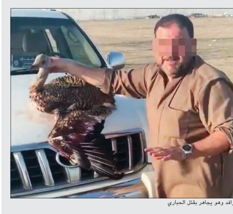
الوافد وهو يجاهر بقتل الحباري