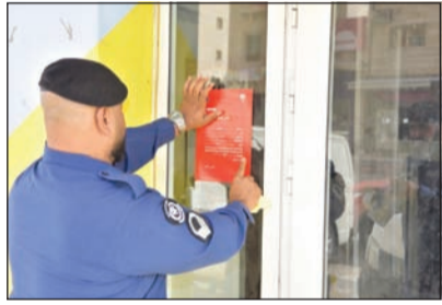
إطفائي يضع «استيكر» إغلاق إداري على منشأة مخالفة

واصلت الإدارة العامة للإطفاء حملاتها الوقائية على منطقة جليب الشيوخ. وقال مدير وقاية محافظة القروانية العميد عبدالله الدوسري ان فرق التفتيش تعمل صباحا ومساء على مدى شهر في رغبة جادة لإزالة كل ما يشوه وجه البلاد الحضاري ويعرض الأرواح والممتلكات للخطر، وشملت الحملة أكثر من 435 محلا ومبنى وأصدرت 234 مخالفة وجر غلق 92 موقعا مخالفا.