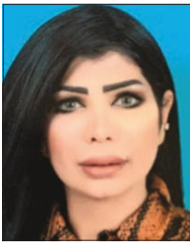
الحامية بشراء الشمري

للقوف على التفاصيل، ونظرا لخشيتهما من ان تقع ضحية للاعتداء اصطحبت زميلتها لتوفير الحماية، إلا ان المدعي عليه وحسب افادتهما قام باحتجازهما واعتدى عليهما. هذا، ومن المقرر إعادة التحقيق في الواقعة للوصول الى الحقيقة كاملة، خاصة ان هناك حلقة مفقودة في القضية تتعلق بملايسات الاحتجاز والاعتداء المزعوم.