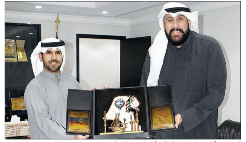
الشيخ فهد الناصر متمسلاً درعاً تذكارية من يوسف الفضلي

وكان كامل عبدالجليل قد أكد خلال افتتاح المعرض حرص المجلس الوطني على دعم ورعاية الفنانين من أبناء الكويت، مشيداً بالنشاط المحموم في حركة فن الكاريكاتير في البلاد، والتي تتجلى في أوجه عديدة منها الرياضة عبر المعرض الحالي، وأضاف «الرياضة فن،