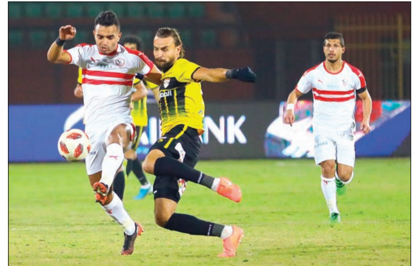
الزمالك سقط في فخ التعادل من جديد أمام الإنتاج الحربي