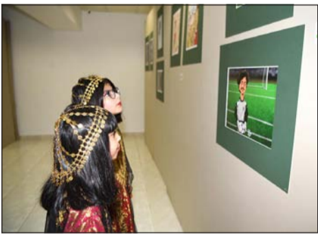
معرض الكاريكاتير جذب الصغار والكبار