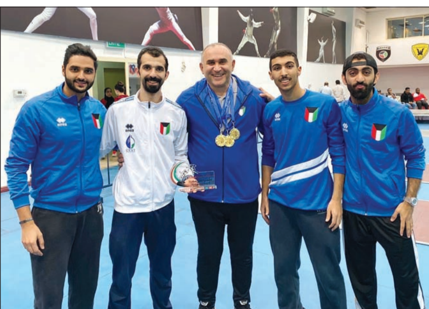
لقطة لأبطال منتخب الكويت للمبارزة