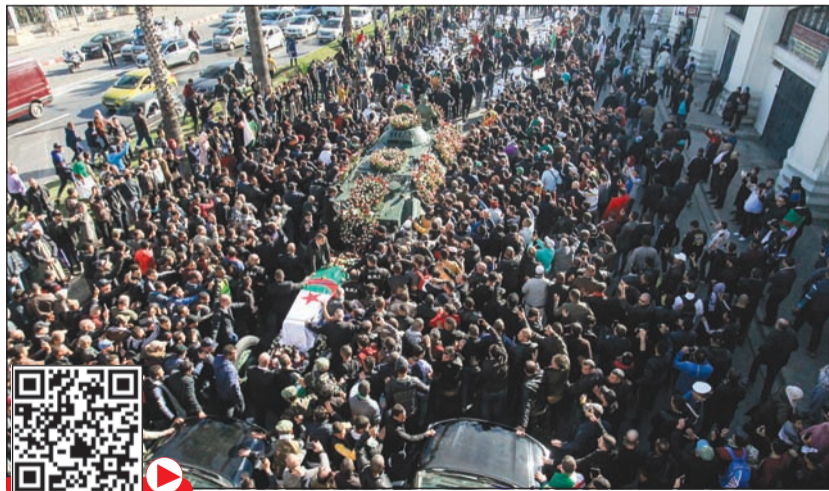
الجزائريون يشيرون رئيس الأركان الراحل أحمد قايد صالح (أ.ف.ب) مشاهدة الفيديو

العسكري «عين النعجة»، إلى قصر الشعب التابع لرئاسة الجمهورية حيث أقيمت عليه النظرة الأخيرة من قبل المسؤولين في الدولة والمواطنين. وغالب الرئيس تبون دموعه أثناء إلقائه النظرة الأخيرة على جثمان رئيس الأركان الراحل حيث انحنى على النعش ورفع يديه بالدعاء وهو يتحامل على نفسه فيما لمعت الدموع في عينيه، وذلك قبل أن يقدم واجب العزاء لأفراد عائلة الفريق صالح. وقال تبون إن الجزائر فقدت «صان رجال الأبطال الذي بقي إلى آخر لحظة وفيما لمساره الزاخر بالتضحيات الجسام». وأضاف أن وفاة قايد صالح تعتبر «فاجعة اللمة قاسية.. أن تودع الجزائر في هذا الوقت بالذات»، مشيراً إلى أن رئيس الأركان «صان الأمانة وحفظ الودعة وأوفي بالعهود في فترة من أصعب الفترات التي اجتازتها البلاد».