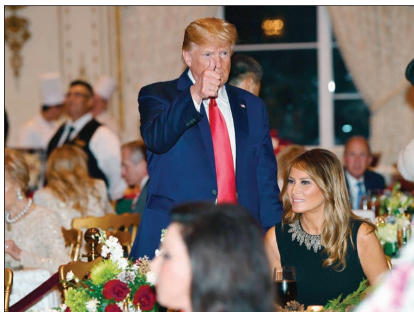
دونالد ترامب وزوجته ميلانيا أثناء حضورهما حفل غداء الكريسماس في فلوريدا أمس الأول

وتابع «نحن لا ندعم هذه الممارسات ونعمل على ضمان أن يقوم المتعاملون معنا بالتدقيق بشكل أفضل بالمتعهدين».