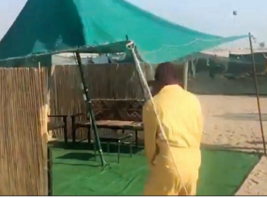
جانب من إزالة المخيمات المخالفة