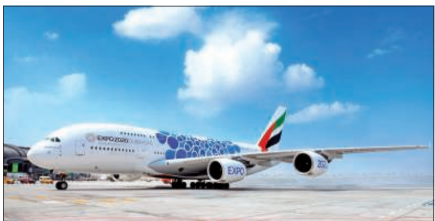
أحدث طائرات «الإمارات» من الطراز العملاق الأيرباص A380

رجال الأعمال، و429 مقعداً مريحاً مع مساحات رحبة بين الصفوف في الدرجة السياحية. وستأخذ الجولة زوار إيرباص الإمارات A380 عبر طابقي الطائرة، وتمنحهم فرصة الاطلاع على منتجاتها وتجهيزاتها الطائرة التي توفر تجربة سفر متميزة، بما في ذلك حمام الشاور، بما في الدرجة الأولى والصالون الجوي لركاب الدرجتين الأولى ورجال الأعمال. وتشغل طيران الإمارات حالياً طائراتها الأيرباص A380 إلى أكثر من 50 وجهة حول العالم، ويضم أسطولها الآن 115 طائرة من هذا الطراز.