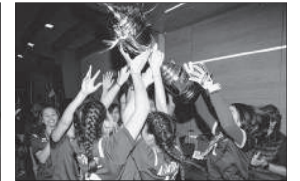
فريق كرة الصالات للسيدات في الجامعة الأمريكية بالكويت يحتفل بعد فوزه