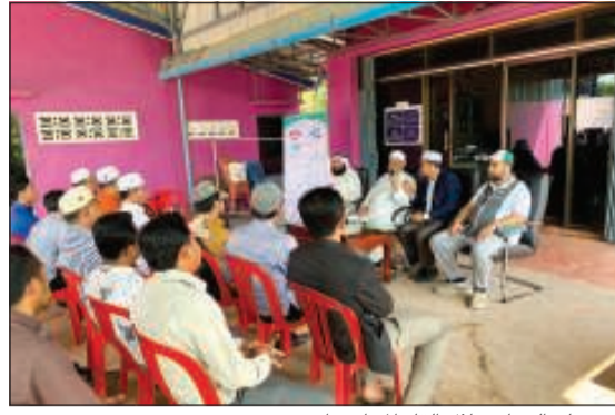
مسؤولو النجاة خلال لقاء المحاضرات

فهكذا هم الأبناء يحتاجون منا توجيه والنصح والمراقبة والمتابعة حتى يكونوا طاقات فاعلة ومشاعل نور تخدم الإسلام والمسلمين. واختتم الخميس بحث أهل الخير والإحسان على دعم المشاريع التعليمية والتنمية الخارجية للنجاة، مؤكدا أننا نناشد المحسنين دعم هذه المشاريع الأبدية التي تنشر العلم وتحفظ القرآن الكريم وعلومه والسنة المطهرة، وتخرج لنا أجيالا رائدة في شتى المجالات.