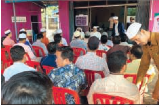
المشاركون خلال المحاضرات