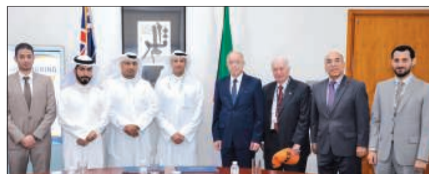
ممثلو شركة creative bits وإدارة الكلية الأسترالية

وقعت الكلية الأسترالية في الكويت مذكرة تفاهم مع كريتف بتس سوليوشنز للتجارة العامة بالتعاون في مجال رعاية المواهب من الكلية الأسترالية في الكويت.