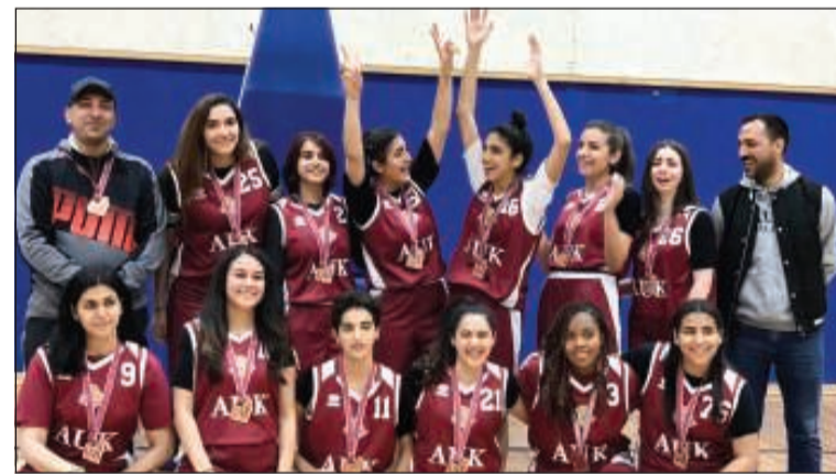
فريق كرة السلة للسيدات في الجامعة الأمريكية بالكويت