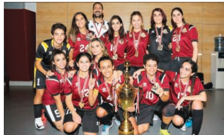
لقطة جماعية لفريق كرة الصالات للسيدات في الجامعة الأمريكية لكرة القدم مع مدربين