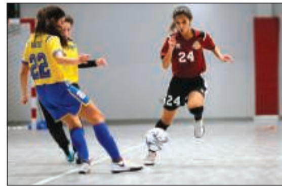
من المباراة النهائية