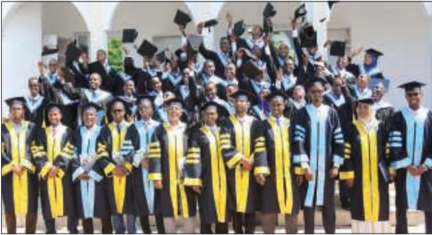
لقطة تذكارية لعدد من الخريجين

احتفلت جمعية العون المباشر بمرور 20 عاماً على إنشاء جامعة سيمد في الصومال والتي تخرج فيها حتى الآن أكثر من 6500 طالب وطالبة.