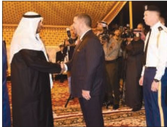
جانب من المهنتين