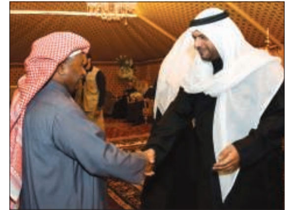
تهنئة بثقة القيادة السياسية

أوصت بضرورة تسويق الخدمات الإلكترونية للبنك