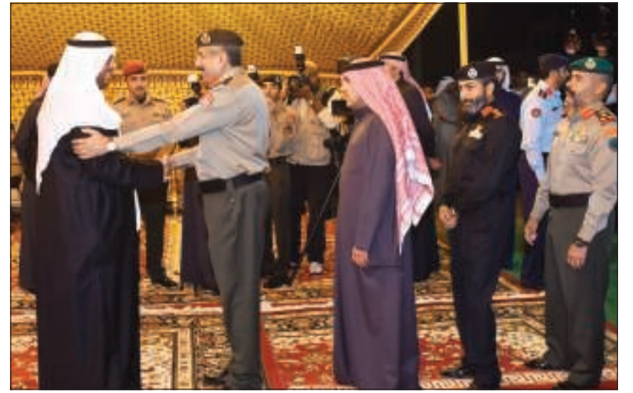
الشيخ أحمد المنصور يتلقى التهاني خلال الحفل (أحمد علي)

شدد خلال استقبال المهنيين بنادي الجيش على ضرورة تحقيق المصلحة العامة وترسيخ مبدأ العدالة والمساواة بين منتسبي الوزارة