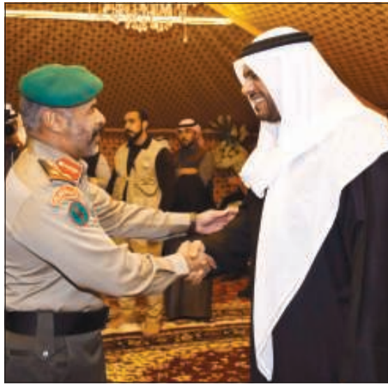
المنصور يتلقى تهاني أحد القادة