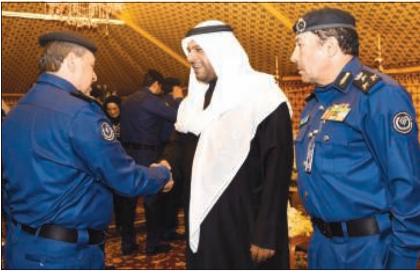
..وتهنئة لوزير الدفاع بمناسبة توليه مهام منصبه