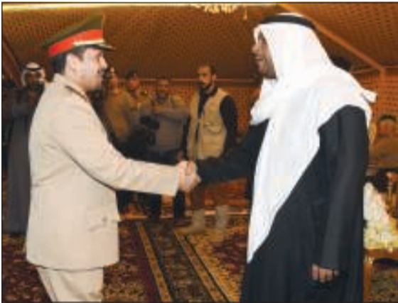
أحمد القادة مباركا للشيخ أحمد المنصور

استقبل نائب رئيس مجلس الوزراء ووزير الدفاع الشيخ أحمد المنصور مساء أمس الأول بنادي ضباط الجيش حشود المهنيين بمناسبة توليه ثقة القيادة السياسية وتعيينه بمنصبه الجديد. وبهذه المناسبة توجه الشيخ أحمد المنصور بالشكر لمقام صاحب السمو الأمير الشيخ صباح الأحمد القائد الأعلى للقوات المسلحة ولسمو ولي العهد الشيخ نواف الأحمد وسمو رئيس مجلس الوزراء الشيخ صباح الخالد على منحه هذه الثقة الغالية. وأكد المنصور خلال حفل الاستقبال أن تحقيق الإصلاح والارتقاء بمستوى الأداء لن يتحقق إلا بتعاون وتضافر كل الجهود بين مختلف القطاعات بالوزارة العسكرية منها والمدنية، وأن يضع الجميع نصب أعينهم تحقيق المصلحة العامة وترسيخ مبدأ العدالة والمساواة بين جميع منتسبي وزارة الدفاع، سائلاً المولى عز وجل أن يعينه على تحمل هذه الأمانة، وأن يكون عند حسن ظن وثقة القيادة السياسية، وأن يديم سبحانه على وطننا الغالي نعمة الأمن والأمان والعزة والاستقرار تحت ظل قيادتنا الحكيمة. حضر الاستقبال رئيس الأركان العامة للجيش الفريق الركن محمد الخضمر وعدد من كبار القيادات بوزارة الدفاع.