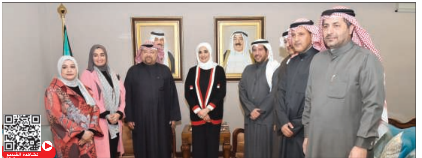
مساهمة الفيديو (محمد هندراوي)