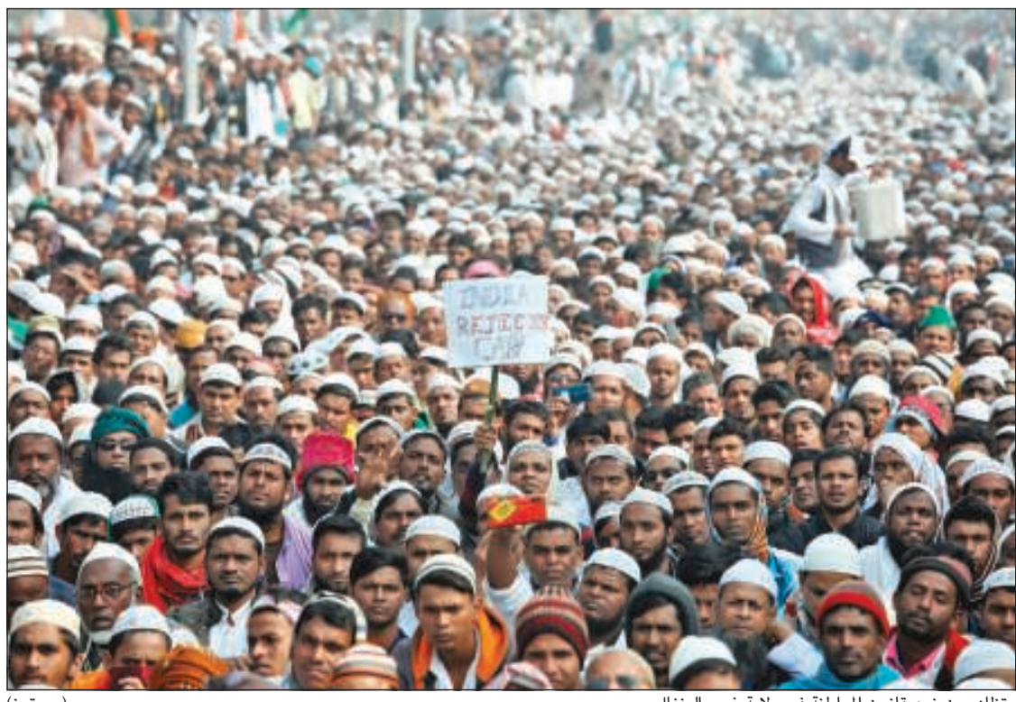
متظاهرون ضد قانون المواطنة في ولاية غرب البنغال

عواصم - وكالات: حضر رئيس الوزراء الهندي ناريندرا مودي تجمعا سياسيا لحزبه الهندوسي القومي في العاصمة نيودلهي أمس، بعد أيام من احتجاجات عنيفة في أنحاء متفرقة من البلاد رفضا لقانون الجنسية الجديد الذي ينطوي على تمييز ضد المسلمين. وشارك عدة آلاف في التجمع الذي حضره مودي واتهم فيه المعارضة بتشويه الحقائق للحض على خروج احتجاجات. وقال «القانون لا أضر له على 1,3 مليار هندي، وأطمئن المواطنين المسلمين في الهند بأن هذا القانون لن يغير أي شيء بالنسبة لهم». وأضاف أن حكومته تطرح الإصلاحات دون أي تحيز ديني. وقال «لم نسأل أبدا أي فرد ما إذا كان يذهب إلى معبد أم إلى مسجد عندما يتعلق الأمر بتطبيق برامج الرعاية الاجتماعية». ويعتزم حزب مودي الحاكم عقد أكثر من مائتي مؤتمر صحافي لمواجهة الاحتجاجات مع تنامي الغضب الشعبي مما يصفه منتقدو القانون بأنه هجوم على الدستور العلماني للبلاد. وخرجت مظاهرات جديدة في نيودلهي أمس وفي ولاية أوتار براديش شمال البلاد والتي شهدت سقوط أكبر عدد من القتلى. وفي جانبها، قال وزير خارجية بنغلاديش