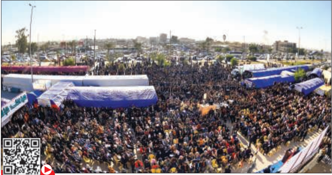
المتظاهرون يجتمعون خارج بوابة جامعة الكوفة

عواصم - وكالات: أعاد المتظاهرون العراقيون رفع الصوت في وجه تسويق السياسيين غير القادرين على التوافق حول رئيس جديد للوزراء مع انتهاء المهلة الدستورية أمس، وأمام إصرار الجارة الإيرانية التي ترفض التنازل عن خيارها. وأقدم آلاف المتظاهرين على قطع الطرقات وإغلاق الدوائر الحكومية في غالبية مدن جنوب العراق من الموعد الذي حددته السلطات لإعلان مرشح لرئاسة الوزراء.