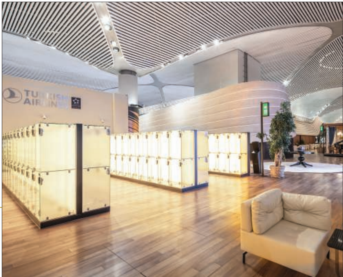
صناديق زجاجية لتخزين الامتعة لحين مغادرة اللانج