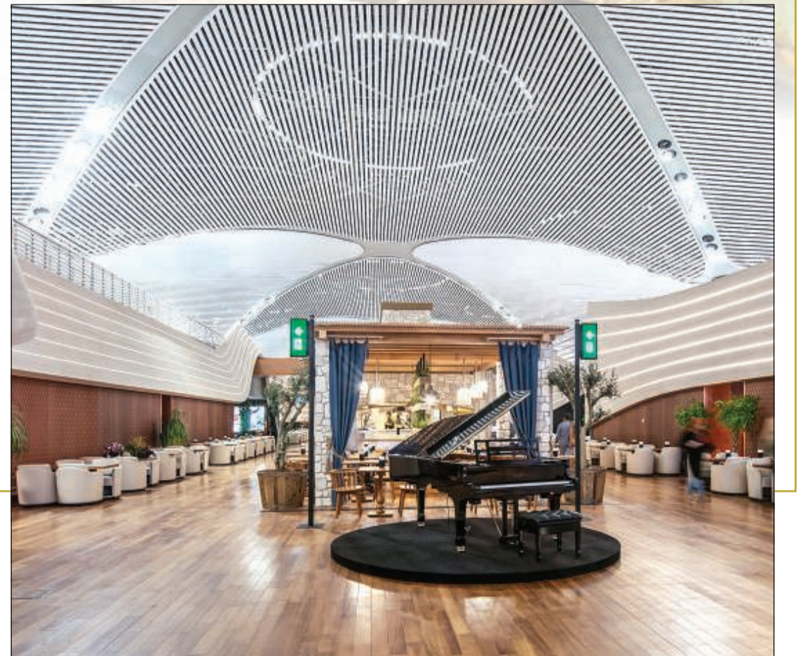
أحدى زوايا لاونج برنس التركية