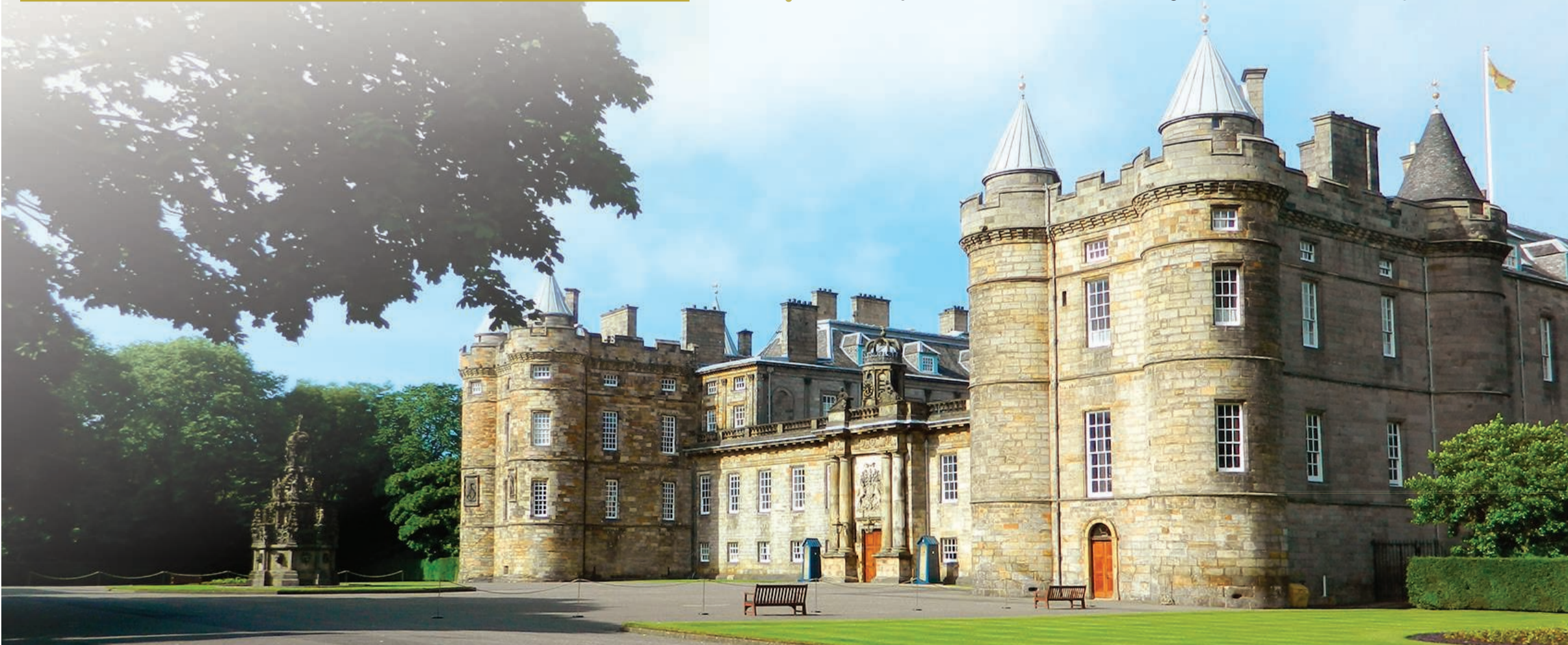
قصر هوليرود هاوس

وفي سانت أندرو ستترين يوجد سوق اسكتلنديا حيث تتوفر فيه أنواع مختلفة من الجينة والهدايا التذكارية إضافة إلى رؤية مناظر خلابة