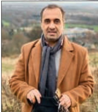
ادنبرة - الإنباء: هادي العجمي

عندما تكون الدعوة من الخطوط التركية والوجهة إلى مدينة أدنبرة الساحرة لا يمكن رفضها، ففي هذه الرحلة اجتمعت راحة السفر والخدمات المميزة من طيران استطاع أن يكون في مقدمة شركات الطيران ليس على المستوى الإقليمي، وإنما على مستوى دول العالم، كما أن الجهة المقصودة هي إحدى أجمل مدن العالم والتي تتنقل بين شوارعها وكأنك تشاهد لوحة فنية جمعت عراقية الماضي ولامح التاريخ لعقود مضت وبين تقدم وحضارة العالم الجديد والتي من أبرز معالمها القلاع التي تحكي كثيرا من قصص التاريخ والأحداث التي غيّرت في العالم أجمع و«أرامينتا كامب بيل» للغزل والنسيج وقصر هوليرود هاوس.