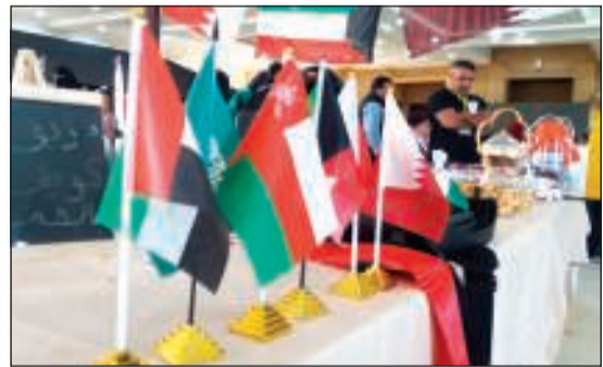
أعلام دول مجلس التعاون في القرية التراثية

السبوعي: الأولى في الكويت المعنية بحقوق المستهلكين