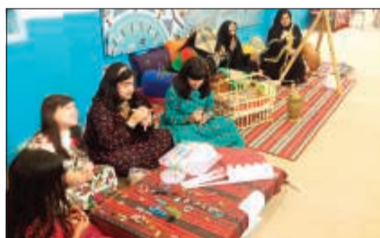
أعمال حرفية في القرية التراثية