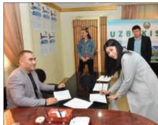
جانب من عملية الاقتراع في سفارة أوزبكستان

ونقل تأكيد رئيس أوزبكستان على توثيق العلاقات الثنائية بين البلدين، وحرصه على نزهة وشفافية الانتخابات من خلال دعوة المراقبين الدوليين من مختلف دول العالم، وتأكيد في خطابه الذي ألقاه يوم الدستور الأوزبكي الذي يصادف 8 ديسمبر من كل عام، وفي ذكرى مرور 27 عاماً على اعتماد الدستور الحالي للبلاد، مبيناً أن بلاده تشهد تطوراً كبيراً في مختلف المجالات، وهذا ما تؤكد تدفقات الاستثمارات الأجنبية مؤخرًا نظراً لما تشهده البلاد من نهضة وتقدم وتطوير في البنية التحتية والتشريعات الجديدة التي تعطي للمستثمر كل الضمانات والحرية لإقامة مشاريع ناجحة تعود بالفائدة على الجميع.