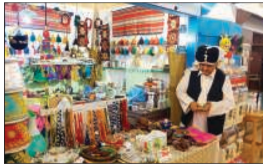
جانب من الفعاليات في القرية التراثية