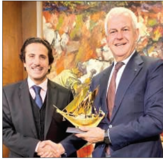
السفير الشيخ عزام الصباح مكرماً رئيس مجموعة ليوناردو الإيطالية أليساندرو بروفومو

تطورا من الطائرات الـ 600 التي تم إنتاجها والتي تعد حتى المقاتلات الأفضل من نوعها في العالم، موضحاً أن تصنيف مقاتلات يوروفايتر يبقى ضمن الجيل الرابع المتقدم وفق التعريف المستحدث لكنه لا ينطبق تماماً على آخر أحدث نماذج اليوروفايتر - دائمة التطور وفق المتطلبات - كونها تشكل جسراً للانتقال إلى مفهوم مقاتلات الجيل السادس الذي يعني أن تكون فيه الطائرات نظاماً ضمن مجموعة أنظمة طائرة من أجهزة وتسليح تتواصل فيما بينها. من جانبه، قال السفير الشيخ عزام الصباح أن القطاع الصناعي والتكنولوجي الإيطالي المتقدم رافد مهم في تعزيز الشراكة الاستراتيجية بين الكويت وإيطاليا التي يعد مشروع «اليوروفايتر» نموذجاً متكامل على هذه الشراكة. وأوضح أنه كذلك مشروع تنموي يرتكز على تأهيل العنصر البشري ونقل وتوطين الصناعة والتقنية التكنولوجية، كما يجسد تطور التعاون الواسع بين الكويت وإيطاليا ويدفع بعلاقاتها المتميزة نحو آفاق أرحب لصالح الشعبين الصديقين.