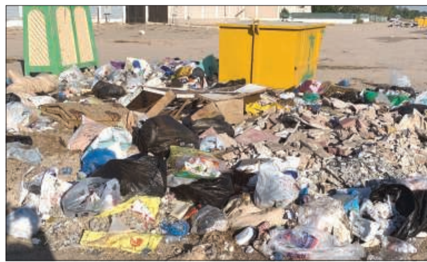
القمامة ملقاة بجوار الدورات المخصصة لها

التحلل، ناهيك عن الملابس والأثاث والمفرشات والسجاد. وشاهدت الكثير من الكلاب الضالة الشاردة التي تجول وتعبث متخذة هذه الأماكن ماوى لها ومسكن. وفوق أكياس القمامة هناك الكثير من القطط والجرذان والحمام.