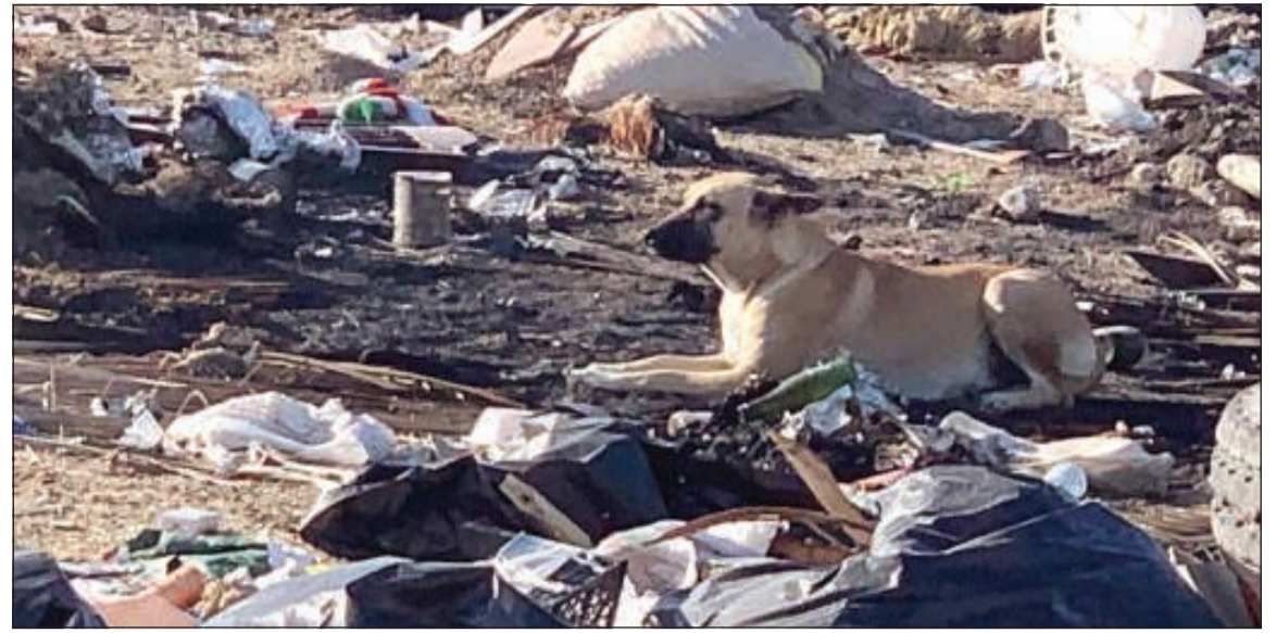
أحد الكلاب الضالة وسط القمامة