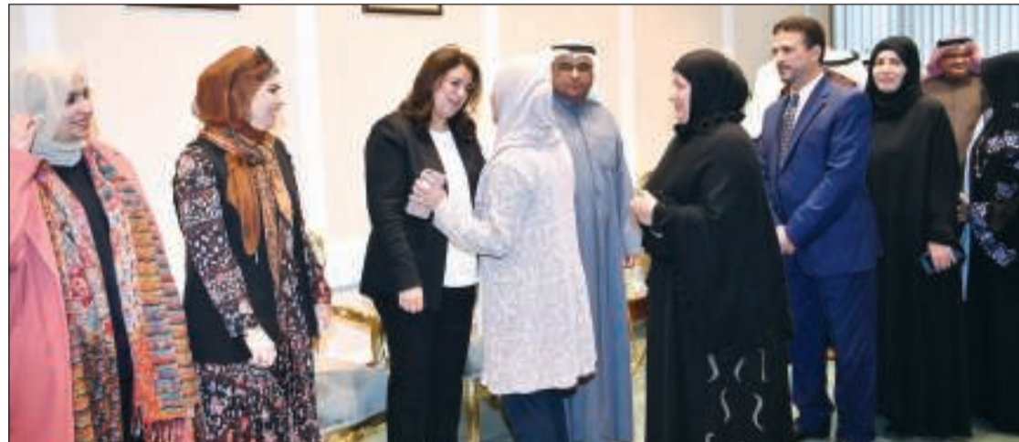
دورنا الفارس خلال استقبال المهنيين في وزارة الأشغال

الفارس: أولوياتي إنجاز مشاريع الطرق ومعالجة تطاير الحصى وحلحلة ملف القضية الإسكانية 07