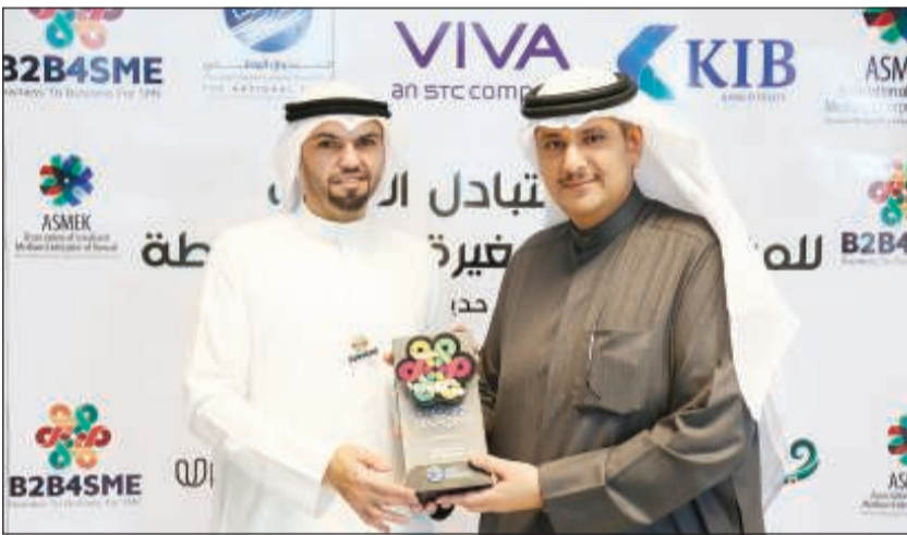
جانب من رعاية «KIB»، لفعاليات ملتقى التبادل التجاري للمشاريع الصغيرة والمتوسطة

للعام الثالث على التوالي، قدم بنك الكويت الدولي (KIB) رعايته لملتقى التبادل التجاري للمشاريع الصغيرة والمتوسطة «B2B4SME» والذي نظمته الجمعية الكويتية للمشاريع الصغيرة والمتوسطة مؤخرًا في حديقة الشهيد. ولقد شارك «KIB» في إحدى جلسات الحوارية التي أقيمت خلال الملتقى، كما ساهم عدد من موظفي البنك المتطوعين في تقديم الاستشارات والإجابة عن استفسارات الحضور حول مزايا الشركات الناشئة والمشاريع الصغيرة والمتوسطة، إلى جانب تعريفهم على الخدمات والمنتجات التي يقدمها البنك لهذا النوع من المشاريع. وعلى هامش المؤتمر الصحافي الذي عقد للإعلان عن فعاليات الملتقى، صرح نائب المدير العام للإدارة المصرفية التجارية - رئيس بيئة مناسبة لدعم أصحاب