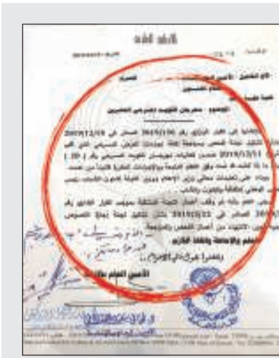
صورة من قرار الوقف

وبشأن إشارته في حفل الختام بشأن «العرض الفائز» سوف يمثل الكويت في الخارج»، وأوضح العنزي أن هذه العبارة جاءت نصاً في مضبطة «اجتماع توزيع الجوائز»، ضمن تعليقات الأعضاء العديدة بشأن مبررات الحجب - وهو قرار لجنة لا قرار فرد - ولم تكن انتقاصاً من اجتهاد المشاركين، أو كوار الحركة المسرحية، «ومعظمهم من أبناء المعهد الذي أتولى عمادته حالياً»، مشيراً: كرئيس للجنة وكمعلن عن قرار حجب بهذه الجدية، كان لزاماً أن ينقل للجمهور - في عبارة مبسطة - أحد أسباب الحجب، فكانت عبارة «العرض الفائز سوف يمثل الكويت في الخارج»، مضيفاً: «أي تفسير آخر لهذه العبارة بعد تأويل لا أساس له من الصحة». وختم رئيس لجنة التحكيم بيانه الصحفي قائلاً: جهود الشباب الكويتي المبدع مثار إعجاب، خصوصاً حينما تكون بلا مقابل مادي، مجدداً الشكر للمجلس الوطني على ما يبذله من جهود، والشكر موصول إلى جميع أعضاء لجنة التحكيم الذين تحملوا المهمة الشاقة، وهم يعلمون جيداً أننا لن نستطيع أبداً إرضاء جميع الأطراف.