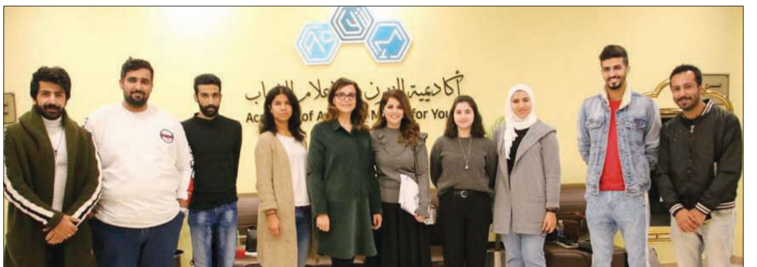
لقطة جماعية للمشاركين

طالبت الفنانة إيسا متابعيها عبر «تويتر»، بالالتزام بعدم التعدي على الأشخاص بالسباب أو الهجوم عليهم، وقالت في تدويتها: «ما مرض سرطان الثدي الذي أصابها به خلال الماضي، وما صفحتي خاصة من العجيبين والأصدقاء، وما بدني إنجبر أعمل بلسوك لحد ما يتعرض