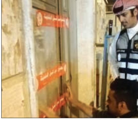
إغلاق محل مخالف في الجليب

استمرار لجهودها الدؤوبة في «تطهير الجليب»، قامت اللجنة الوزارية المشتركة لمتابعة الأوضاع في المنطقة بالتعاون مع الفرق الرقابية في إدارة التدقيق ومتابعة خدمات بلدية محافظة الفروانية، بمتابعة السرايب المخالفة وغير الملتزمة بالتعليمات، فضلا عن إغلاق المحلات المخالفة في جليب الشيوخ.