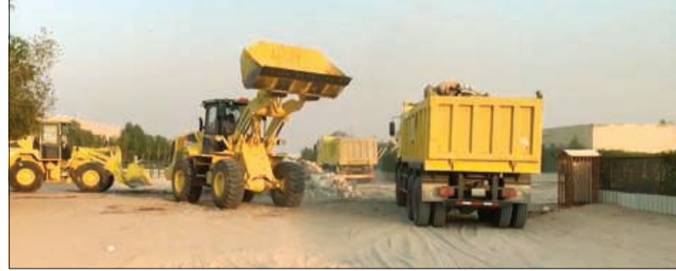
جانب من نقل المخلفات والانقاض في كبد