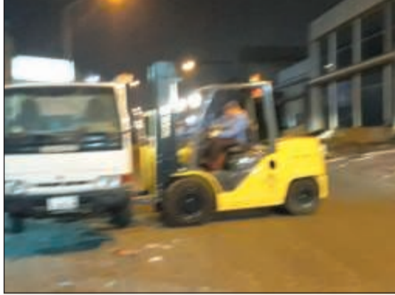
رفع إحدى السيارات المخالفة

في إطار جهود البلدية المتواصلة لتطبيق القوانين واللوائح والحفاظ على المظاهر الجمالية في مختلف المدن والمناطق، قامت النوبة «ب» بمركز نظافة الشويخ برفع 11 سيارة مهمة في منطقة الشويخ وتحريك 13 مخالفة، وذلك ضمن الحملة التي أطلقتها تحت شعار «#خلها نظفة» للمحافظة على مستوى النظافة في جميع الأماكن.