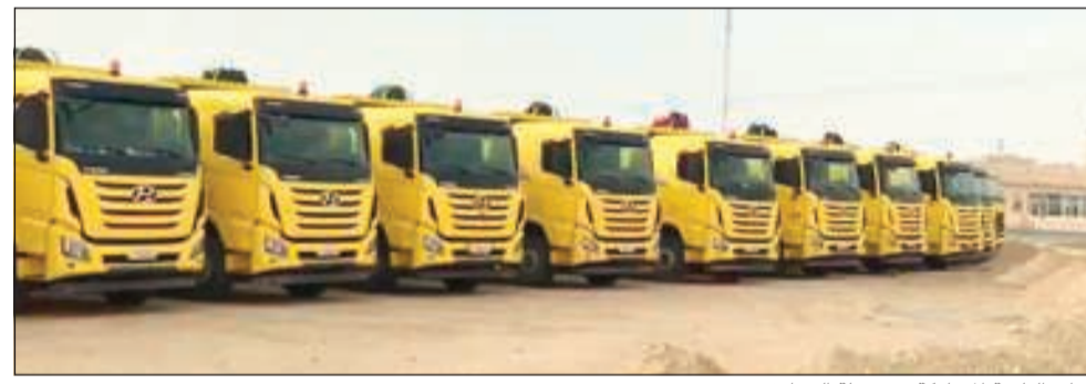
كيات البلدية المشاركة في حملة التنظيف