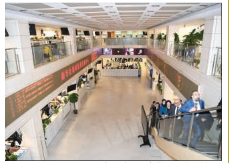
وفد «الأنباء» الإعلامي داخل وكالة الأنباء الصينية (شينخوا)