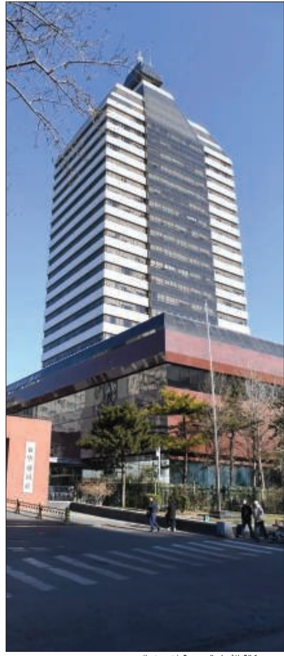
مبنى وكالة الأنباء الصينية (شينخوا)