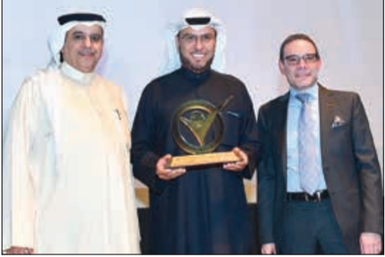
العنزي متسلما جائزة الإبداع في العلاقات العامة والتميز بالإعلان التلفزيوني

حصلت شركة الخطوط الجوية الكويتية على 3 جوائز من حفل جائزة الكويت للإبداع لعام 2019، حيث احتلت الشركة مراكز متقدمة ضمن الفئات التي تم تكريمها خلال الحفل. هذا وحازت «الكويتية» على جائزة الإبداع في العلاقات العامة عن الفئة الأولى، وعلى جائزة التميز في سرعة النمو بعمليات التسويق الخاصة بالتميز والإبداع، أما بالنسبة للجوائز التنافسية فقد حاز إعلان الخطوط الجوية الكويتية لأغنية «أنا رديت» للفنان الكبير عبد الكريم عبدالقادر على جائزة التميز بالإعلان التلفزيوني.