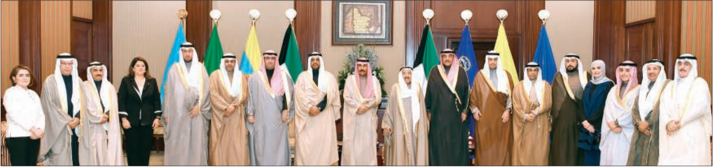
صاحب السمو الأمير الشيخ صباح الأحمد وسمو ولي العهد الشيخ نواف الأحمد في صورة تذكارية مع سمو رئيس مجلس الوزراء الشيخ صباح الخالد وأعضاء الحكومة الجديدة ويبدو أمين عام مجلس الوزراء عبداللطيف الروضان

صباح الخالد: القضاء على الفساد واستئصاله بجميع أشكاله وأنواعه.. وحماية المال العام وحرمة في مقدمة أولويات الحكومة