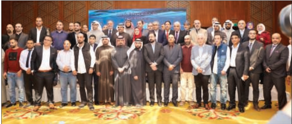
صورة جماعية للمشاركين

من تقنيات وتطورات، كما استطاع أن يوفر كل احتياجات البناء، وأحدث وأرقى منتجات التشطيبات والديكور التي تتوافق مع ذوق المواطن الكويتي. وأضاف أن الدورة الحالية للمعرض، حملت أفكاراً جديدة لمختلف مراحل عملية البناء، ما يدعم ثقة الجهات الحكومية والخاصة ذات العلاقة بهذا التجمع الوطني السنوي الكبير والمهم، معربة عن سعادتها بالنجاح الباهر الذي حققه المعرض في الدورة الحالية، بالإضافة إلى نجاح ورش العمل التي نجح ورش العمل المقدم من جهات مختلفة والتي كان من بينها ورشة العمل الخاصة بوزارة الكهرباء والمباني الذكية، وورش العمل الخاصة بفريق عمل تشطيباتي تحت عنوان «رحلة بناء» مختلف المنتجات المتعلقة بمستلزمات البناء والتشييد والتعرف على مواد البناء الحديث والتصميم الداخلي