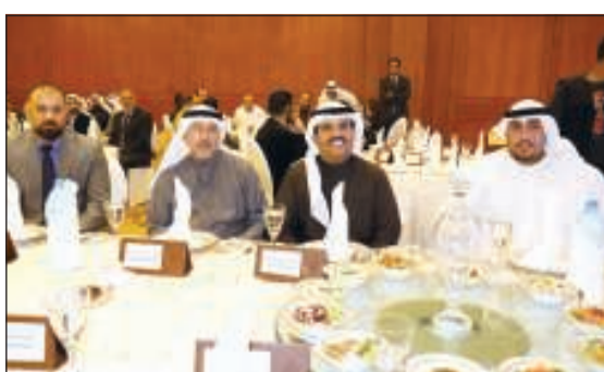
راعي الحفل الشيخ دعيج الخليفة

تحت رعاية وحضور المستشار الشيخ دعيج الخليفة الصباح وصقوة من رجال الأعمال لقطاع الإنشاء في الكويت، أقامت شركة «أكسبو-تاج» للمعارض والمؤتمرات حفلاً خاصاً لتكريم الرعاة والمشاركين في معرض الصناعات والبناء التاسع الذي نظّمته الشركة خلال الفترة من 9 إلى 12 ديسمبر الجاري، بفندق «الجميرا - الكويت»، بمشاركة العديد من الجهات المختصة في عالم البناء والتشييد من القطاعين الحكومي والخاص. وقالت المدير التنفيذي لـ «أكسبو-تاج»، داليا وفائي في تصريح صحافي على هامش حفل التكريم، إن معرض الصناعات والبناء التاسع، قام بطرح مختلف المنتجات المتعلقة بمستلزمات البناء والتشييد والديكور، بما يواكب آخر مستجدات هذه الصناعة