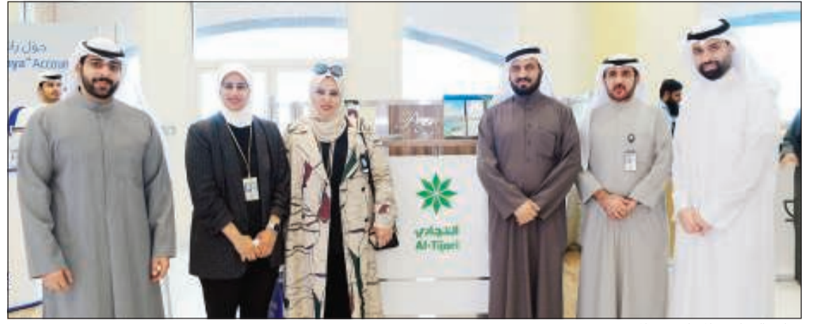
جناح «التجاري» المشارك في المعرض

في إطار تعزيز تواصل البنك مع كل شرائح العملاء ضمن خطة تسويقية شاملة تهدف إلى تعريف جمهور العملاء بالمنتجات والخدمات المصرفية المتنوعة التي يقدمها البنك، شارك البنك التجاري الكويتي في فعالية اليوم المفتوح للبنوك المحلية الذي نظّمته الشركة الكويتية لنفط الخليج في مقر الشركة. وقام موظفو إدارة التسويق في البنك بعرض الخدمات المصرفية الشاملة التي يقدمها التجاري وأيضاً مجموعة الحسابات المتوافرة لدى البنك على موظفي الشركة ومنها حساب الخدمات المصرفية الشخصية الذي يوفر لحامليها مجموعة قيمة من الخدمات والمميزات الحصرية لتلبية جميع احتياجاتهم المصرفية. من ناحية أخرى، تم تعريف زوار جناح التجاري على الخدمات المصرفية الرقمية التي يقدمها البنك لعملائه مع التركيز على خدمة (T-Pay) لتحويل ودفع الأموال باستخدام تقنية رمز الاستجابة السريعة (QR Code)، والتي استقطبت اهتمام العديد من رواد