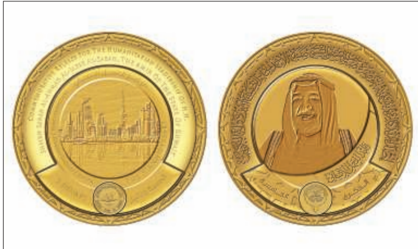
مسكوكة تذكارية مذهبة