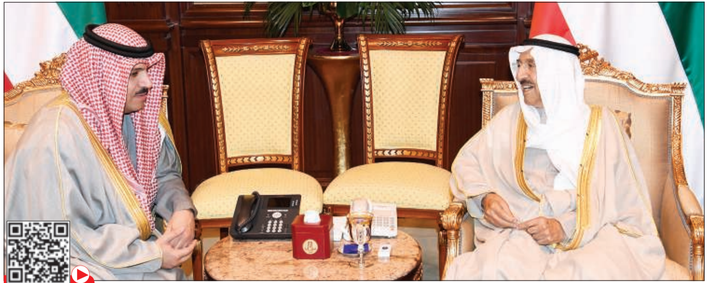
صاحب السمو الأمير الشيخ صباح الأحمد مستقبلاً د.محمد الهاشل