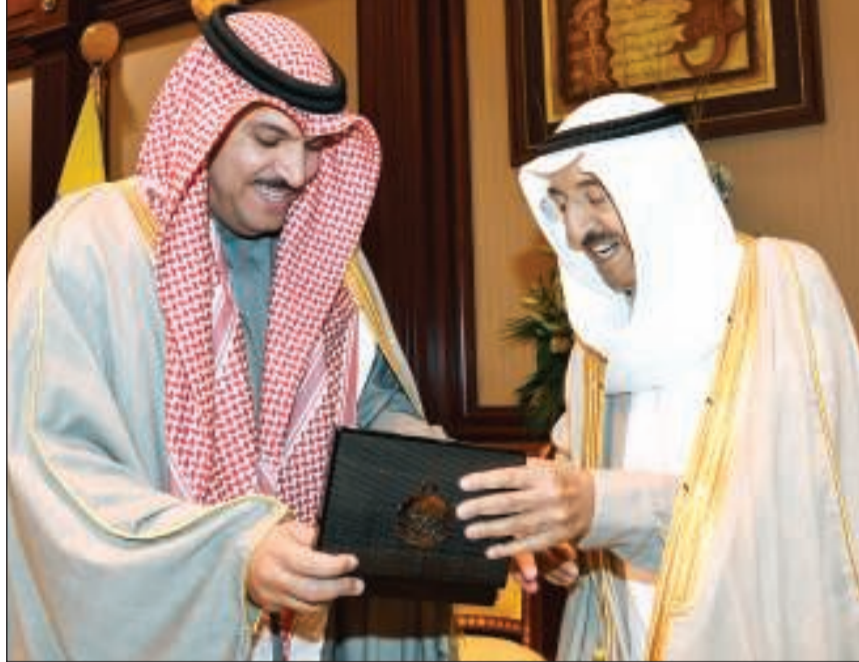
صاحب السمو الأمير الشيخ صباح الأحمد يتسلم من محافظ البنك المركزي د.محمد الهاشل المسكوكة التذكارية