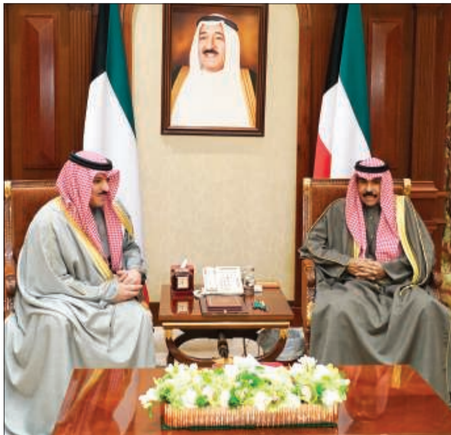
سمو ولي العهد الشيخ نواف الأحمد مستقبلاً د.محمد الهاشل

استقبل صاحب السمو الأمير الشيخ صباح الأحمد بقصر بيان أمس محافظ بنك الكويت المركزي د.محمد الهاشل. كما استقبل سمو ولي العهد الشيخ نواف الأحمد بقصر بيان صباح أمس د.محمد الهاشل. من جهة أخرى، قال محافظ بنك الكويت المركزي د.محمد الهاشل: إنه احتفاء بالذكرى الخامسة لتسمية صاحب السمو الأمير الشيخ صباح الأحمد «قائداً للعمل الإنساني» عام 2014 من قبل منظمة الأمم المتحدة، وتقديراً لجهود سموه وإسهاماته في رفع معاناة شعوب العالم المنكوبة ودعم نصرة القضايا الإنسانية، إلى جانب جهود سموه وإسهاماته في حل الخلافات بالطرق السلمية، فقد أصدر بنك الكويت المركزي مسكوكة تذكارية مذهبة. وأوضح المحافظ أن تصميم هذه المسكوكة التذكارية قد استلهم من هذه المناسبة، حيث تحمل على وجهها الأمامي عبارة وصورة صاحب السمو في وسط الوجه الأمامي للإصدار تحيط بها عبارة «إصدار تذكاري بتسمية حضرة صاحب السمو الشيخ صباح الأحمد أمير الكويت قائداً للعمل الإنساني»، ويحمل الوجه الثاني للإصدار ترجمة لهذه العبارة باللغة الإنجليزية، ومشهداً من البحر لمدينة الكويت يظهر فيها مبنى بنك الكويت المركزي، بالإضافة إلى ذلك يحمل هذا الوجه شعار بنك الكويت المركزي والقيمة الرمزية للمسكوكة. وأعرب د.الهاشل عن بالغ اعتزازه بهذه الذكرى التي تجسد مناسبة كريمة ستظل فخراً للكويت ولكل مواطن وسجلاً مضيئاً في تاريخ البلاد. الجدير بالذكر أن الإصدار جاء متوافقاً مع المقاييس العالمية للمسكوكات التذكارية، حيث يبلغ قطره 38,61 ملم.