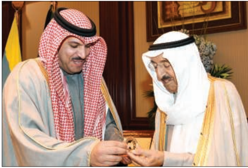
صاحب السمو الأمير لدى تسلمه المسكوكة من د.محمد الهاشل