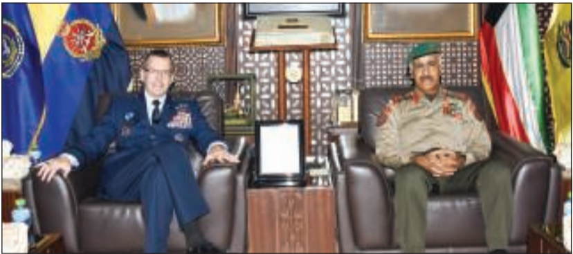
الفريق الركن محمد الخضر مستقبلاً الفريق سكوت كيندنغفتر

الودية ومناقشة أهم الأمور والمواضع ذات الاهتمام المشترك، لإسما المتعلقة بالجوانب العسكرية. حضر اللقاء المحقق العسكري الكويتي لدى مملكة بلجيكا الصديقة اللواء الركن كيندنغفتر وسمو ولي العهد الشيخ نواف الأحمد، ببرقية تهنئة إلى رئيس مجلس الوزراء الشيخ صباح الخالد ببرقية تهنئة مماثلة.