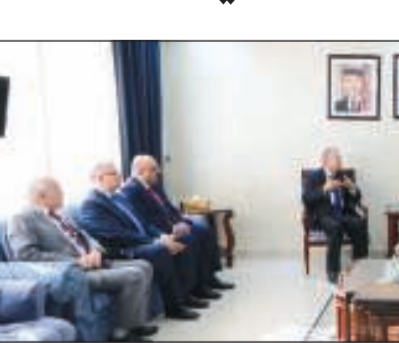
رئيس مجلس النواب الأردني خلال لقائه مدير عام المعهد العربي للتخطيط