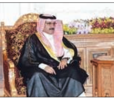
نائب رئيس الوزراء المعاني مستقبلاً الشيخ مبارك الدعيج

2020 ومواصلة العمل بالمف السباحي (النشرة السباحية العربية) ومواصلة العمل بملف الخدمة الإعلامية النسوية. واعتمد المؤتمر نتائج مسابقة أفضل صورة صحافية للعام الحالي 2019، والتي فازت فيها وكالة الأنباء السعودية وجائزة أفضل تقرير صحفي وفازت فيها وكالة الأنباء والمعلومات الفلسطينية. وهنأت الجمعية العمومية وكالة المغرب العربي للأنباء على استضافة أعمال مؤتمر الدولي السابع لوكالات الأنباء الدولية.