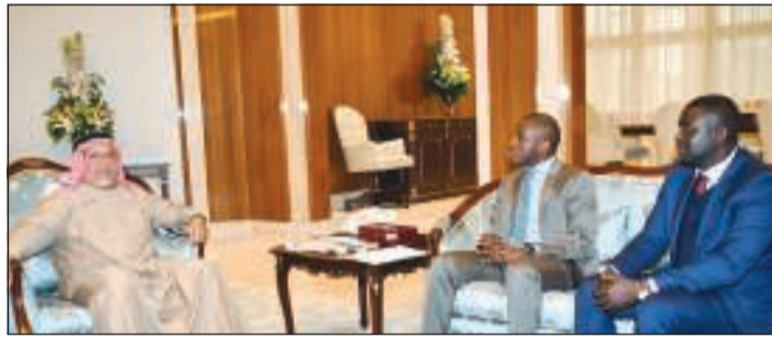
الشيخ علي الجراح يتسلم رسالة رئيس دولة فلسطين لصاحب السمو الأمير