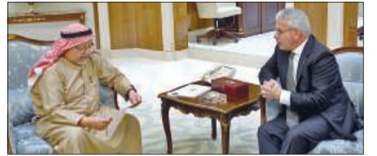
الشيخ علي الجراح يتسلم رسالة رئيس دولة فلسطين لصاحب السمو الأمير