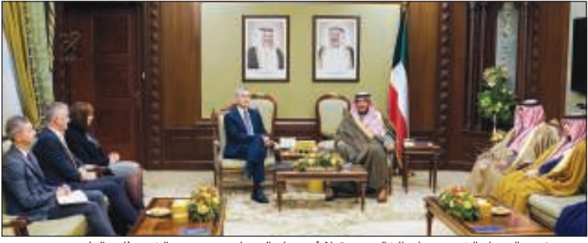
سمو رئيس الوزراء الشيخ صباح الخالد مستقبلاً أمين عام الـ «ناتو» بحضور الشيخ ثامر العلي

شمال الأطلسي «ناتو» جاسم محمد البديوي. كما تلقى سمو رئيس مجلس الوزراء الشيخ صباح الخالد رسالة خطية من رئيس وزراء جمهورية غينيا بيساو الصديقة أرستيديز غوميز تضمنت العلاقات الثنائية التي تجمع البلدين والشعبين الصديقين وسبل تعزيزها في مختلف المجالات، وقد قام بتسليم الرسالة إلى وزير شؤون الديوان الأميري الشيخ علي الجراح سفير جمهورية غينيا بيساو لدى المملكة العربية السعودية والمحال إلى الكويت مدامو سانو.