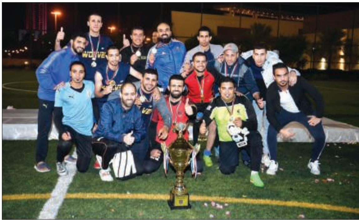
تتويج «سويت هوم» ببطولة الفنادق الثالثة (قاسم باشا)