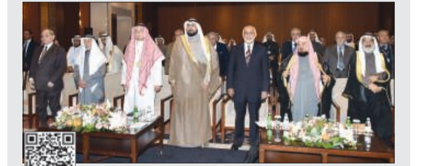
الشيخ دباسل الصباح ود.محمد الجارالله وعبدالله المنيع ود.عجيل النشمي في مقدمة الحضور خلال انطلاق مؤتمر الوثيقة الإسلامية (ريليش كوما)

باسل الصباح في افتتاح مؤتمر المنظمة الإسلامية للعلوم الطبية: قانون المسؤولية الطبية سيعرض على مجلس الأمة قريباً 02