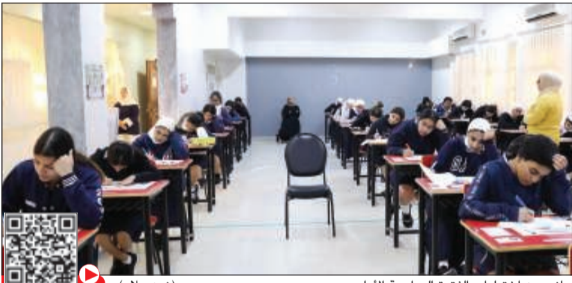
جانب من اختبارات الفترة الدراسية الأولى (زين علام) مشاهدة الفيديو

نجحت الإجراءات المشددة التي اتخذتها وزارة التربية في الحفاظ على سير الاختبارات في اليوم الأول أمس في ضبط أحد طلبة المرحلة الثانوية وبحوزته أوراق «شعوزة»، بها طلاس وكتابات غير مفهومة كان يحاول إدخالها إلى قاعة الاختبار. وكثفت الوزارة جهودها لتهيئة الأجواء المناسبة في مختلف المدارس. وقال الوكيل المساعد للتعليم العام بوزارة التربية أسامة السلطان إن الاختبارات سارت بشكل طبيعي في يومها الأول، مؤكداً أن الوضع «سهود ومهود»، ولا يوجد شيء يدعو للقلق، متمنياً التوفيق والنجاح لجميع أبنائنا الطلبة. وقام السلطان بزيارات تفقدية على لجان الاختبارات في بعض المدارس بهدف الاطمئنان على سير العمل والوقوف على استعداد الإدارات المدرسية لتوفير أفضل سبل الراحة للطلبة لأداء اختباراتهم دون عوائق. التفاصيل ص 8