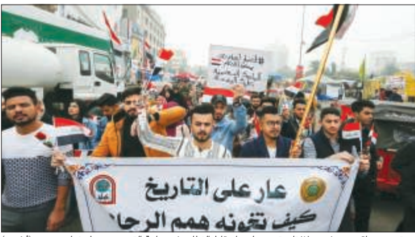
محتجون عراقيون يرفعون لافتات تصر على «إسقاط النظام» في ساحة التحرير وسط بغداد

الأول على يد مسلحين مجهولين في أحد أحياء بغداد. لكن حملة التخويف والخطف وقتل الناشئة أخفقت حتى الآن في ثني المتظاهرين عن مواصلة احتجاجاتهم المطالبة بـ «إسقاط النظام». وقال ناشطون ان مئات المتظاهرين يتوافدون إلى ساحة التحرير في بغداد يوميا، حيث ينظمون نشاطات وفعاليات تتعلق بتحديد هوية المرشح الجديد لمنصب رئيس الحكومة ورفض المرشحين المقترحين من الطبقة السياسية والحزبية. التفاصيل ص 29