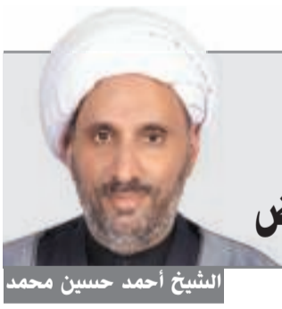
الشيخ أحمد حسين محمد

على المواطنة العادلة لجميع الأفراد، والرابعة أن نظام الحكم فيها يقوم على نظام الشورى والتداول الديموقراطي. لقد انتقلت عمان بحكم السلطان قابوس بداية من عام 1970 من دولة مؤسسية ذات هيكل تقليدية إلى دولة مدنية حديثة ذات مؤسسات وتنظيم قانوني معاصر، وهذه خطوة مهمة تساعد على الحفاظ على التسامح والتعايش في الداخل لتطوير المجتمع