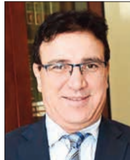
السفير عبد الملك بوهودو

في مقدمة أولويات مهمتي كسفير لدى الكويت من خلال تفعيل اتفاقيات وآليات التعاون الثنائي في مجالات المالية والسياحة والأشغال العمومية والنقل والتعليم العالي والإتصال والثقافة والرياضة. وقال: إنه لمن حسن الحظ وجود جالية جزائرية نخوية مقيمة في الكويت، وطيب لي التنويه من هذا المقام بأنها تحظى بالعناية من قبل سلطات دولة الإقامة كاشقاء للشعب الكويتي وتمتع بالاحترام والتقدير لما تساهم به في المسيرة الاقتصادية المتحذرة. وتابع كلامه: إلى الجانب السياسي والمؤسساتي، لقد وضعت التعاون الاقتصادي وتشجيع الاستثمار والشراكة والتبادل