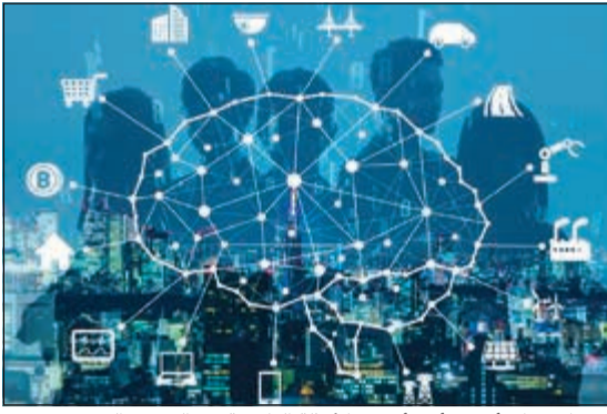
بنك الائتمان أصبح أحد أفضل الأمثلة الناجحة في التحول الرقمي

ويعتبر بنك الائتمان من أوائل البنوك في الكويت والشرق الأوسط التي قامت بإنجاز أعمال تركيب وتشغيل البنية التحتية الخاصة بالخدمة السحابية للنسخ الاحتياطية (Avamar) بنجاح. وكان بنك الائتمان دشّن مطلع نوفمبر الماضي مشروع (موقع الطوارئ والكوارث لحفظ النسخ الاحتياطية للبيانات) بالتعاون والتنسيق مع شركتي مايكروسوفت (EMC Dell) العالميتين.