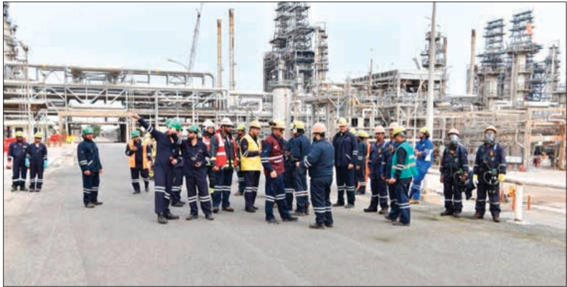
جانب من عملية الإخلاء

حالات طارئة محتملة، تنوها إلى أنه أعقب العملية تدارس الحالة لتلافي أي ثغرات مستقبلية في التمارين المماثلة.