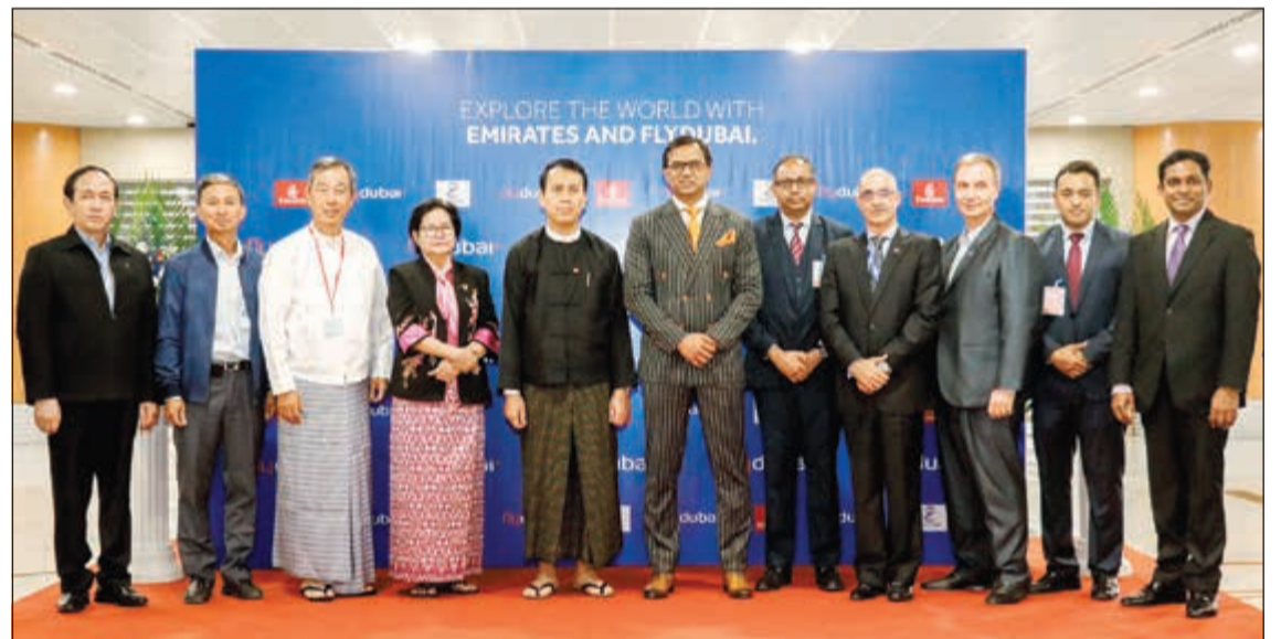
لقطة جماعية خلال الاحتفال

وستكون هذه الرحلة ضمن رحلات الرمز المشترك مع طيران الإمارات، حيث يحظى ركاب طيران الإمارات بوجبات مجانية وأوزان الأمتعة المسموح بها على الرحلات التي تديرها فلاي دبي في درجة رجال الأعمال والدرجة السياحية. وقال جوزيه أنغيبا الرئيس التنفيذي للعمليات في شركة يانغون إيرودروم والتي تشغل مطار يانغون: «نحن سعداء باستقبال شركة طيران دولية جديدة، ودورها لن يقتصر فقط على الرحلات المباشرة لمنطقة الشرق الأوسط ودي، باعتبارها شريان رئيسي للوجهات الأوروبية والأمريكية إلى يانغون، ولكن أيضاً إضافة مسار جديد إلى كرابي (تايلاند)، وزيادة حركة السفر من وإلى هذه المنطقة والتي ستؤدي إلى تدفق حركة الزوار إلى ميانمار وتعزيز حركة السياحة وربط المناطق الثلاث».