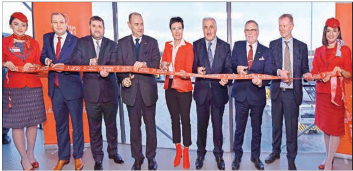
جانب من مراسم الاحتفال بالرحلة الافتتاحية

رحلاتنا المتصلة التي تغطي 317 مدينة في 126 بلداً. يذكر أن الشفق القطبي ينشأ من تفاعل الجسيمات المشحونة من الشمس مع الحقل المغناطيسي لكوكب الأرض، وحين تحصل هذه الظاهرة الطبيعية في القطب الشمالي، تسمى شفق الشمال. وإن تقع روفانييمي على خط القطب الشمالي، فإنها من أفضل المواقع لمشاهدة شفق الشمال. وتعتبر مدينة روفانييمي من أكثر وجهات السياحة الشتوية شعبية في العالم بفضل تنوع أنشطتها الشتوية وموقعها الممتاز لمشاهدة شفق الشمال، كما تقدم عدة خيارات فريدة لزوارها من مختلف أنحاء العالم، بما فيها أكواخ القبة الزجاجية الصديقة للبيئة، والفنادق الجليدية.