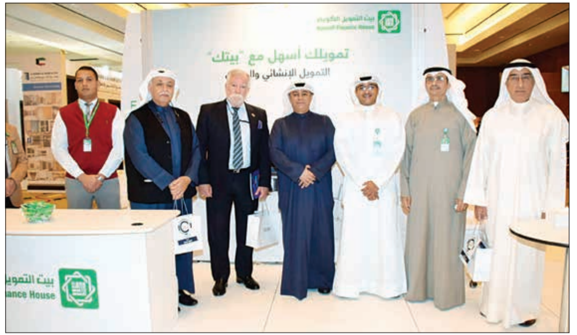
جناح «بيتك» في المعرض

المباشر والخدمات التمويلية، للرد على استفسارات العملاء والزوار، وكذلك تقديم شرح عن الخدمات التمويلية التي يقدمها «بيتك» للعملاء والتي تشمل جميع متطلبات البناء. وخلال المعرض، سلط «بيتك» الضوء على حملته التمويلية «تمويلك أسهل مع «بيتك»، المصممة للعملاء الراغبين بشراء المواد الإنشائية أو التعاقد لإنجاز الأعمال الإنشائية. وتتيح الحملة مميزات متكاملة لتسهيل عملية التمويل، بالإضافة إلى استشارات وإرشادات هندسية قبل وأثناء البناء، واستشارات بشأن مواد وأعمال البناء من حيث أفضل المصادر والأسعار، ومتابعة تنفيذ الأعمال بالتعاون مع مهندسين مختصين، وهامش ربح تنافسي إذ لا تخضع الأرباح