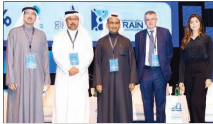
لقطة جماعية للمشاركين بالجلسة النقاشية