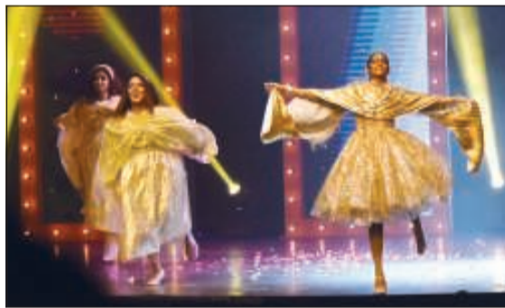
إحدى فقرات حفل الافتتاح