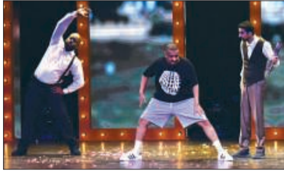
جانب من عرض مسرحية «الميعاد»