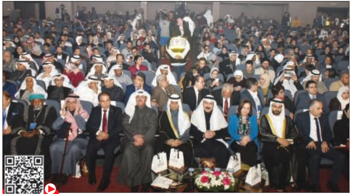
جانب من الحضور الجماهيري والدبلوماسي في افتتاح المهرجان

في حضور دبلوماسي وجماهيري لافت للنظر في مسرح الدسمة