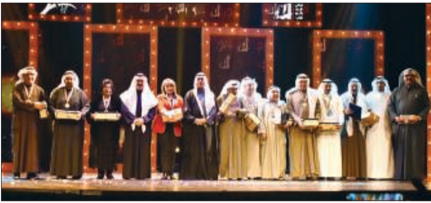
لقطة جماعية للمكرمين في الدورة الـ 20