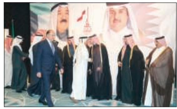
تهنئة السفير القطري في الكويت