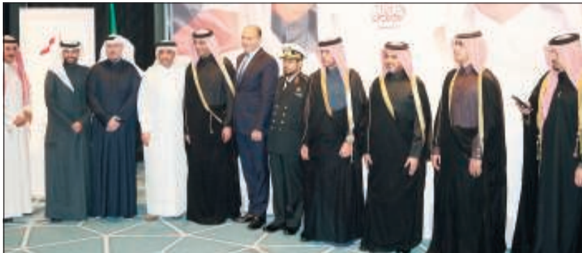
لقطة جماعية خلال الحفل

على مكافآت تصل إلى 500 دينار، يمكنه استبدالها من أي من شركائها المميزين في برنامج «مكافآت نجوم» الفريد من نوعه، والذي يقدم للعملاء أفضل الخدمات من نخبة الشركات في قطاعات مختلفة. كما يستطيع عملاء هذه الباقات الحصول على خدمات حصرية مميزة في قاعة النخبة المخصصة لهم في الدور الخامس في مقر الشركة الرئيسي في المرقاب، شارع السور.