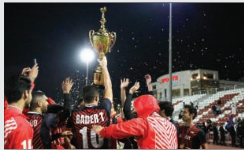
AUM نفوز بالمركز الأول في دوري الجامعات الخاصة لكرة القدم 09

«رويتزر»: صعدت أسهم أرامكو السعودية بالحد الأقصى المسموح به البالغ 10٪ فوق سعر الطرح العام الأولي في ظهورها الأول ببورصة الرياض أمس، وذلك في تطور لاقى احتفاء من الحكومة باعتباره برهاناً على صحة تقييمها الشاهق لشركة النفط الوطنية عند تريليوني دولار. وقفز السهم إلى 35,2 ريالاً، متجاوزاً سعر الطرح الأولي البالغ 32 ريالاً وعند الحد