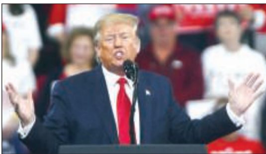
دونالد ترامب يواجه احتمالات العزل

واشنطن - وكالات: يكاد الرئيس دونالد ترامب أن يصبح ثالث رئيس أميركي يواجه احتمالات العزل في الكونغرس، غير أنه أبعد عن السقوط وخسارة منصبه مما كان يتوقع معارضوه. وقبل أقل من 11 شهراً عن الانتخابات الرئاسية أواخر 2020، يبدو الملياردير الجمهوري متسلحاً باستراتيجية دفاع شرسة جداً وبارقام اقتصادية جيدة. ورغم جسامته الاتهامات التي أعددتها الديمقراطيون بـ «إساءة استخدام السلطة» وعرقلة «العدالة»، فإن المعادلة السياسية تشي بأنه يوشك على تجاوز هذه العقبة