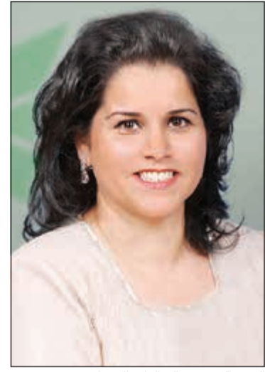
الشبيخة نواف سالم العلي الصباح

وكشفت الشبيخة نواف أن رزنامة التجاري وإصداراته المتميزة وأنشطته الأخرى المرتبطة بإحياء التراث الكويتي تضاف إلى تاريخ البنك الطويل وجهوده المكثفة لإحياء التراث الكويتي القديم بهدف تذكير أجيال اليوم والغد بأنماط الموروث الشعبي الكويتي والمحطات المهمة في تاريخ الكويت، وما تعكسه من معانٍ وعبرٍ يجب أن تظل حاضرة في الأذهان ولا تغيبها عجلة الزمان. واختتمت الشبيخة نواف حديثها متوجهة بالشكر لكل من ساهم في توثيق المعلومات التراثية التي احتوتها رزنامة عام 2020، مؤكدة أن «التجاري» مستمر في مسيرته نحو إحياء التراث الكويتي القديم وكذلك تسليط الضوء على أهم الحقب الزمنية في تاريخ الكويت بإصداراته المميزة التي لا تنتهي بانتهاء العام، بل تبقى مستمرة لتذكر الأجيال القادمة بالماضي القديم وتوثقه حتى لا يذهب طي النسيان، وطمينة أن يحمل عام 2020 كل الخير والأمنيات الطيبة للجميع.