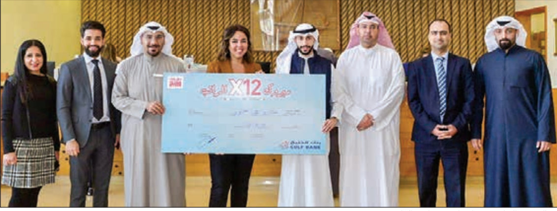
ممثلو بنك الخليج بعد الإعلان عن اسم الفائز

من دون فوائد حتى 10000 دينار، شرط ألا يقل الراتب الذي يتم تحويله إلى بنك الخليج عن 500 دينار. وبإمكان العملاء الجدد الحصول على بطاقات فترا وماستراكارد الائتمانية من دون رسوم سنوية في العام الأول، مع إمكانية الحصول على قرض تصل قيمته إلى 70000 دينار وتسديده خلال مدة 15 سنة، أو قرض استهلاكي تصل قيمته إلى 25000 دينار.