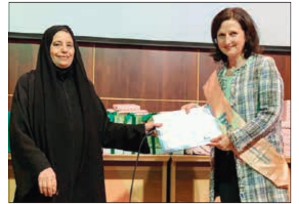
حرم سفير النمسا تشارك في توزيع الشهادات على الخريجات