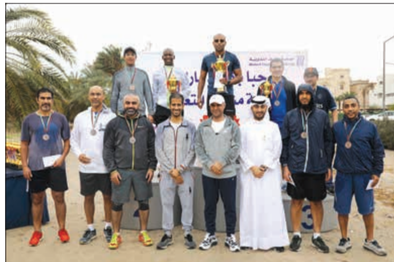
تكريم الفائزين بماراثون مشرف