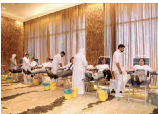
جانب من عملية التبرع بالدم