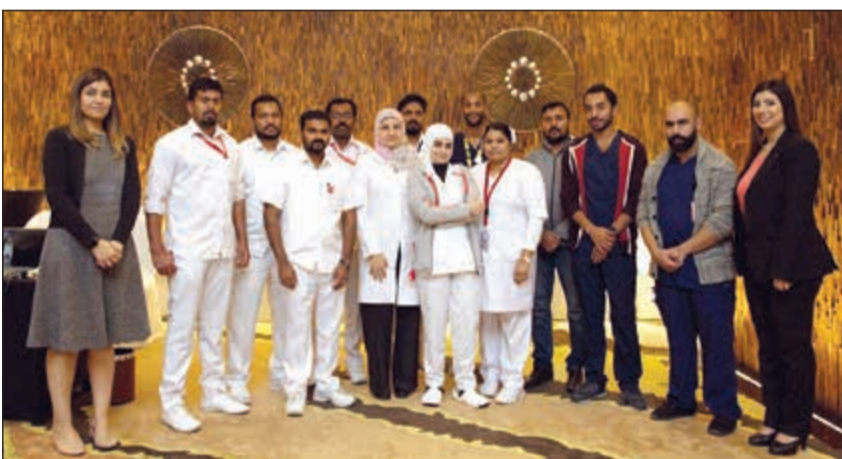
لقطة تذكارية مع فريق بنك الدم في قاعة «السود»

هذا، وخصصت إدارة الفندق إحدى قاعاتها المميزة، وهي قاعة «السود»، لإقامة الوحدة الخاصة بالتبرع بالدم وتوفير التسهيلات اللازمة للطواقم الطبي التابع لبنك الدم المركزي الكويتي، كما وزعت الإرشادات والتعليمات على المتبرعين. وتولى الفريق الطبي تسجيل المتبرعين والإجراءات اللازمة في الوقت الذي نظمه فيه طاقم الفندق أعمال الإشراف وتنظيم صفوف المتبرعين