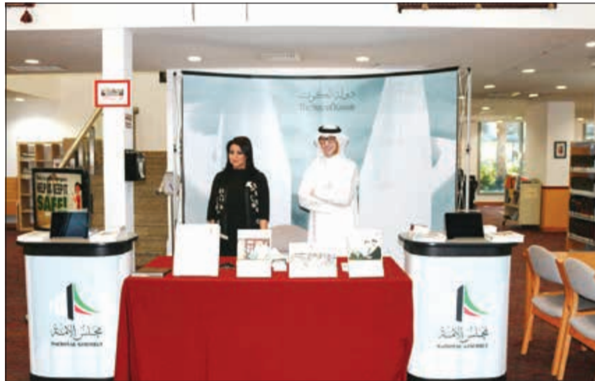
ممثلون عن مجلس الأمة في مكتبة الجامعة

ولطرح الأسئلة التي قد تساعدهم في دراستهم، بالوجود في المكتبة لتلقي المعلومات عن دستور الكويت وتاريخها بحضور أعضاء هيئة التدريس والموظفين وخاصة الطلاب. وكان من المثير للاهتمام استكشاف معارفهم في هذا المجال وقضاء وقت كبير في مناقشة ما يمكن أن تضيفه هذه المعلومات إلى دراستهم.