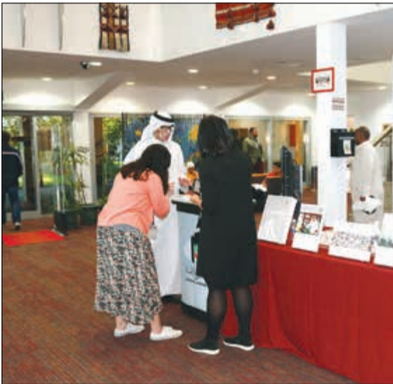
مجموعة من AUK خلال زيارتهم للمعرض