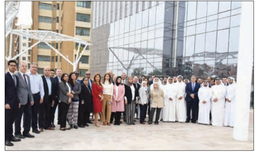
صورة جماعية للإدارة العليا لـ«المركز» خلال افتتاح البرج

7,124، وتجهيزات كهربائية للشقق تسهل أهم المتطلبات اليومية، إلى جانب توفير الخزائن المخفية في كل الوحدات. وتم تخصيص منطقة خاصة للشواء والجلسات الخارجية على سطح البرج وبجانب حمامات السباحة، حتى يتسنى للأفراد الاستمتاع بأفضل الأوقات بصحة عائلاتهم. ويقدم البرج أيضا منطقتي ألعاب خاصة للأطفال داخلية وخارجية، تمكنهم من قضاء وقت متعة في أمان.