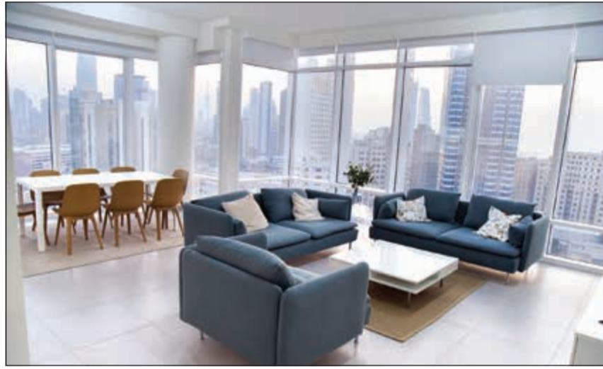
تصميم داخلي حديث وعملي