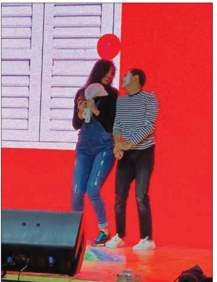
جانبا من فقرات المهرجان

جميعاً أكبر وأفضل وأكثر صحة وأكثر سعادة! وأردف قائلاً: دعوني أقتبس مقولة للفيلسوف اليوناني أرسطو: «إن لكل أكبر من مجموع أجزائه»، بمعنى آخر، عندما نشكل كياناً واحداً، ونسعى إلى خلق شيء أكبر حتماً سيكون ذلك أفضل من أن يبقى كياناً منفصلاً متوقفاً في صوامعه الخاصة... ليس ذلك رائعاً.. لذا دعونا نركب ونترجمه على أرض الواقع من خلال الفنون، فكم من لوحة فنية انضم إليها آخرون في أداء استعراضي مكمّلين بعضهم بعضاً فنتج التآزر الإبداعي والتميز فتحققت «الوحدة في التنوع»؟! وجمعت شعوباً من خلفيات مختلفة (لغوية أو عرقية أو عنصرية أو دينية) فكانت وحدة العالم.