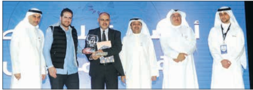
تكريم مدارس النجاة لغزوها بالمركز الأول في المبادرة

تصل الكويت لتحقق «رؤية 2035» وأقول لمدير إدارة مدارس التربية الخاصة د.سلمان الافي «لقد اتعبت من بعدكم»، وعلى وزارات الدولة الأخرى المبادرة والسعي لتحقيق الدمج الشامل. بيدوره، قال مدير إدارة مدارس التربية الخاصة د سلمان الافي: يأتي الاحتفال باليوم العالمي للأشخاص من ذوي الإعاقة الذي تم إقراره في عام 1992 بموجب قرار الجمعية العامة للأمم المتحدة رقم 3/47 بهدف تعزيز حقوق تلك الفئة المهمة من فئات المجتمع، وتحقيق رفاههم في جميع المجالات الاجتماعية والتنموية وإنهاء الوعي بحالهم في الجوانب السياسية والاقتصادية والثقافية، مؤكدا في الوقت نفسه على أهمية تحقيق كافة مكاسبهم، والعمل على نيلهم كافة الحقوق التي نصت عليها القوانين والدساتير الدولية.