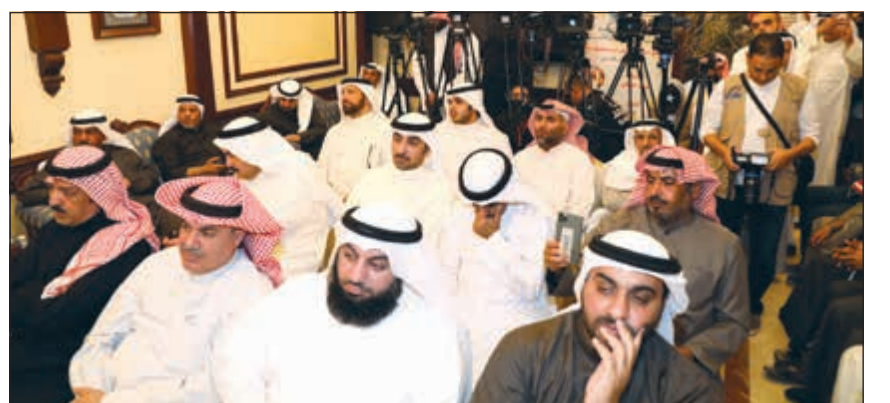
جانب من حضور الندوة (زين علام)