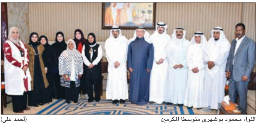
اللواء محمود بوشهري متوسلا المكرمين (أحمد علي)