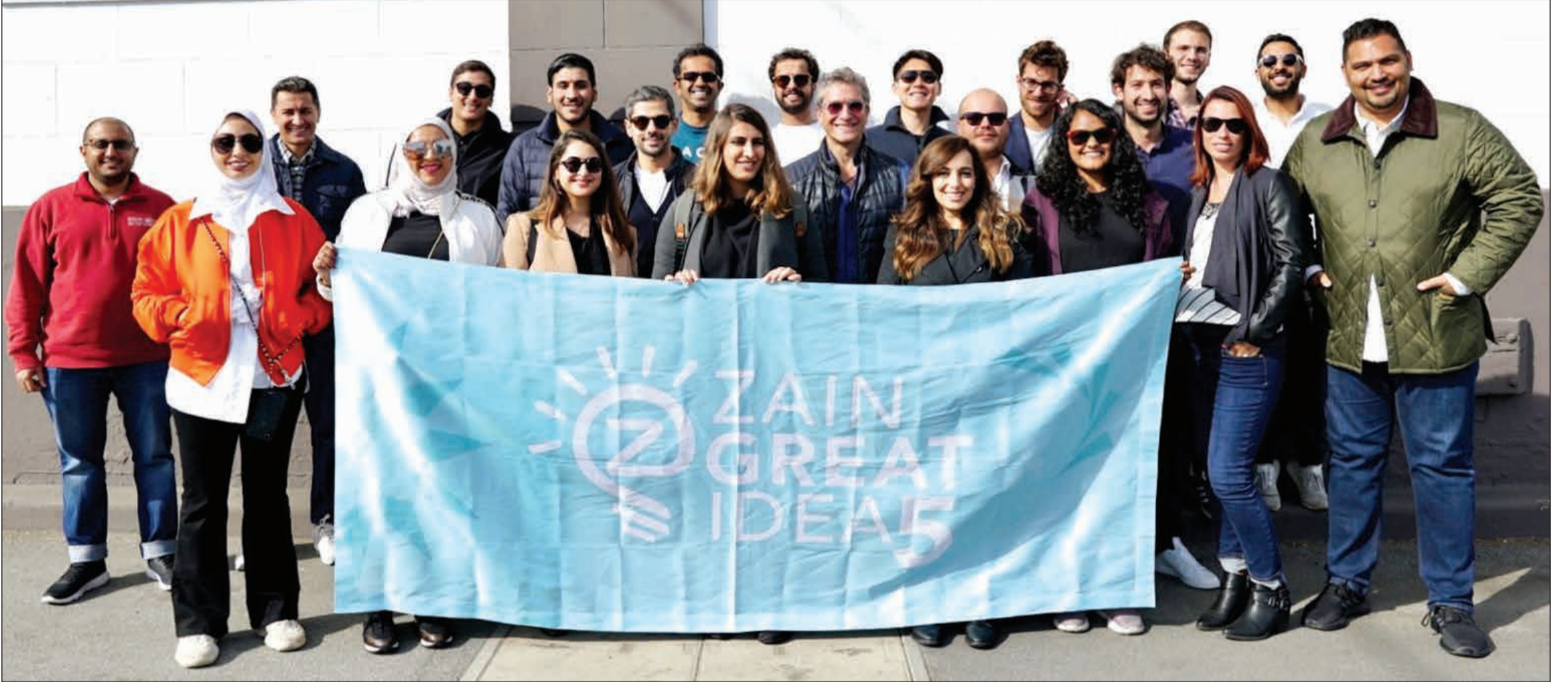
فريق «زين» مع المبادرين المشاركين في برنامج «Zain Great Idea» خلال رحلتهم إلى مدينة سان فرانسيسكو الأمريكية