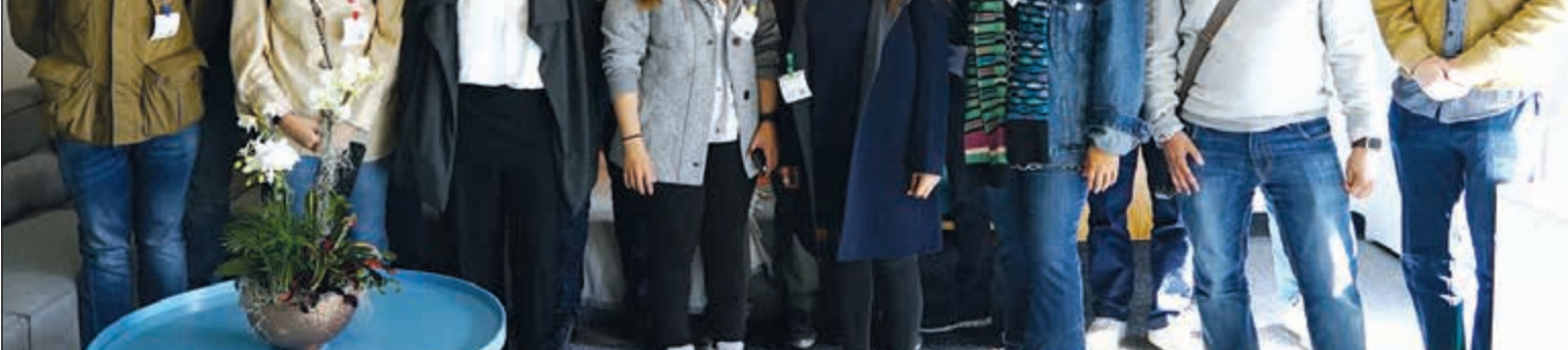
لقطة جماعية للمبادرين خلال مشاركتهم في برنامج «Zain Great Idea»