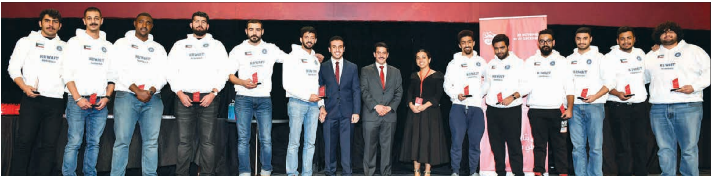
تكريم فريق كرة اليد