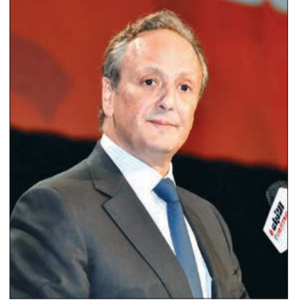
السفير الشيخ سالم العبدالله يلقي كلمته

وختم السفير العبدالله قائلًا: اسأل الله ان يحفظ الجميع وان تتوقف هذه الممارسات السيئة التي لا تمت بصلة للكويت ولتاريخ الاتحاد. وبعد مغادرة السفير، ألقى رئيس المكتب الثقافي في لوس انجليس د.محمد الرشيد كلمة أكد فيها التزام المكتب بتوظيف كل الامكانيات لتسهيل مهمة الطلبة، داعياً إياهم الى المثابرة والاستفادة من وجودهم في اميركا، حيث أفضل تعليم في العالم لتأمين مستقبل مشرف لهم ولبلادهم. بعدها، ألقى رئيس الاتحاد المنتهية ولايته زينفر سعد العازمي كلمة بعد عودته الى القاعة، حيث رافق السفير أثناء مغادرته، وجاء في الكلمة: في بداية حديثي أود أن انتهن هذه الفرصة لتوصيل،