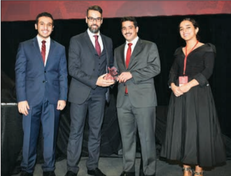
تكريم عمار تقي

فريق «الانباء» - سان دييغو كاليفورنيا بحالة من الحزن والغضب، غادر سفيرانا لدى واشنطن الشيخ سالم العبدالله الحفل الختامي للمؤتمر الـ 36 للاتحاد لطلبة الكويت في اميركا والذي انعقد في مدينة سان دييغو بكاليفورنيا في اعقاب اعمال التخريب التي أدت الى إلغاء الانتخابات وتركت الاتحاد تحت إدارة قيادة مؤتمنة من اللجنة التنفيذية للاتحاد الوطني. وقبل ان يتوجه بخطوات سريعة مغادراً قاعة المؤتمر في فندق «ماريوت ماركينز»، ألقى سفيرانا كلمة مقتضبة جاء فيها: كنت اتطلع الى تهنئة الهيئة الادارية الجديدة خلال ممارسة ديموقراطية شفافة، لكن ذلك لم يحدث بسبب تصرفات غير مسؤولة حرمت الطلاب