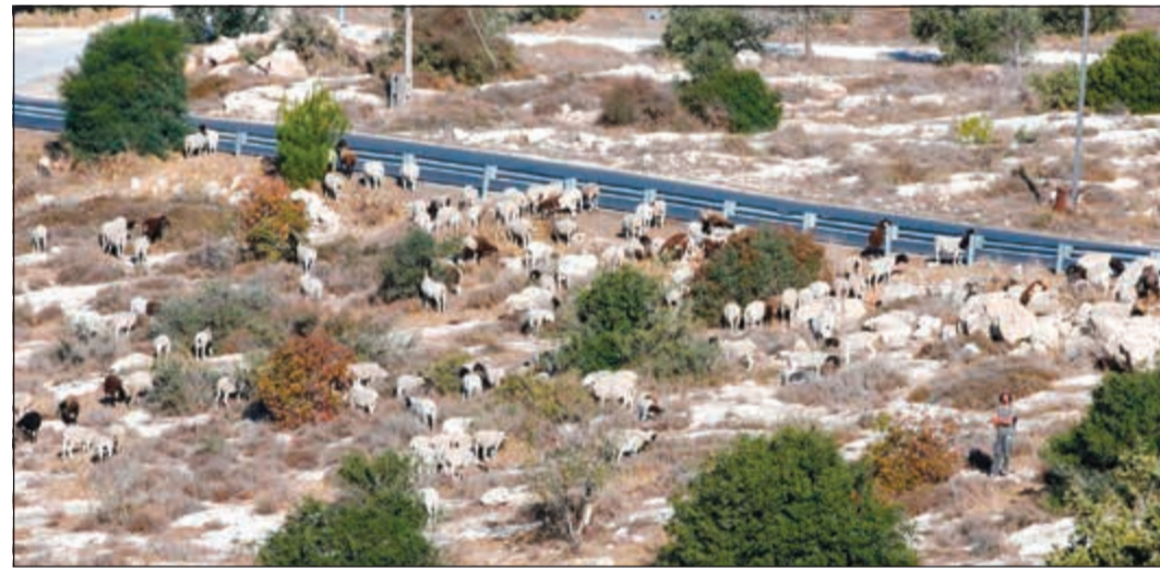
مستوطنات إسرائيلية يزرع اغتنامه في اراض فلسطينية محتلة جنوبي مدينة الخليل امس (إ.ف.ب)

عواصم - وكالات: أصدر وزير الدفاع الإسرائيلي نفتالي بينيت قرارا امس ببدء تنفيذ مخطط لإقامة حي استيطاني جديد في قلب مدينة الخليل بالقرب من الحرم الإبراهيمي الشريف، جنوب الضفة الغربية المحتلة.