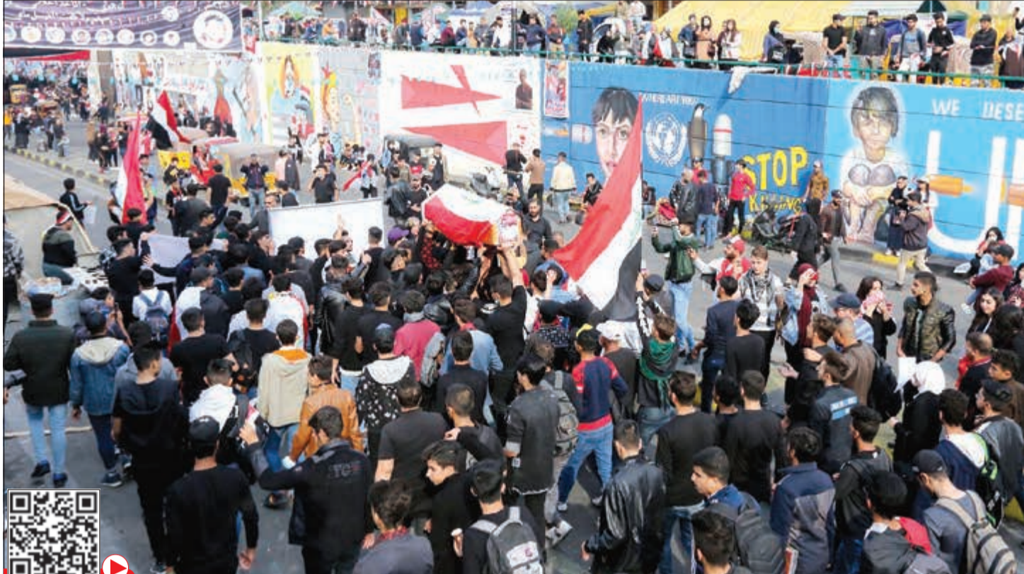
تشجيع أحد ضحايا الاحتجاجات بميدان التحرير في بغداد

عواصم - وكالات: أصبح رئيس الوزراء العراقي عادل عبدالمهدي أعلى مسؤول تطيح به الاحتجاجات العارمة بعد أن وافق مجلس النواب العراقي على استقالته، فيما تواصل السلطات تقديم «أكباش فداء» لتهدئة الغضب الشعبي الذي عم معظم المحافظات على شكل إضراب ومظاهرات حداد.