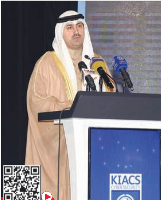
الشيخ نمر الصباح