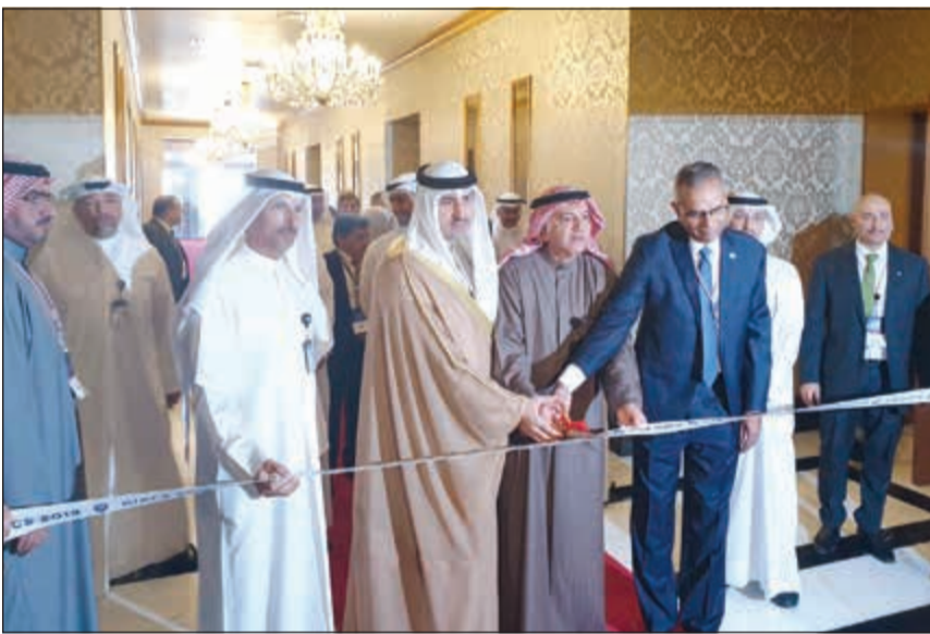
الشيخ نمر الصباح وهاشم هاشم خلال افتتاح مؤتمر الأمن السيبراني لأنظمة التحكم الصناعي (أحمد علي)

وأوضح هاشم أن المؤتمر يهدف إلى الحفاظ على أمن قطاع النفط والغاز من الهجمات والتهديدات السيبرانية، ويضم المؤتمر قائمة من المشاركين