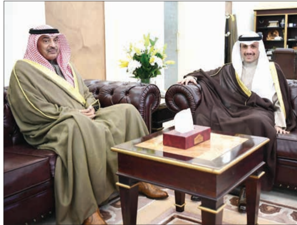
رئيس مجلس الأمة مرزوق الغانم لدى استقباله سمو رئيس مجلس الوزراء الشيخ صباح الخالد في مجلس الأمة أمس

قال رئيس مجلس الأمة مرزوق الغانم إن لقاءه بسمو رئيس مجلس الوزراء الشيخ صباح الخالد تناول مستقبل العلاقة بين السلطتين التشريعية والتنفيذية، مشيراً إلى أن ذلك جاء بناءً على توجيهات صاحب السمو والتي أكد من خلالها على ضرورة تفعيل المادة 50 من الدستور التي تنص على فصل السلطات مع تعاونها. وقال الغانم، في تصريح صحافي بمجلس الأمة أمس عقب استقباله لسمو الشيخ صباح الخالد، إن اللقاء كان ممتازاً، وتحدثنا فيه عن أمور عديدة وجوانب تتعلق بعلاقة السلطتين التشريعية