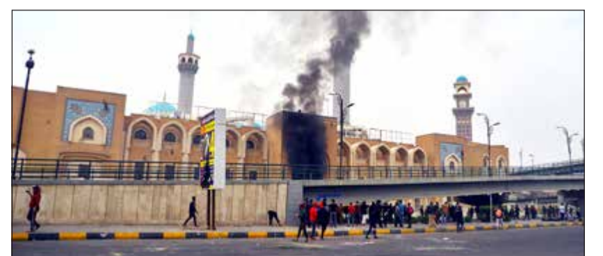
الدخان يتصاعد من مرقد المرجع محمد باقر الحكيم