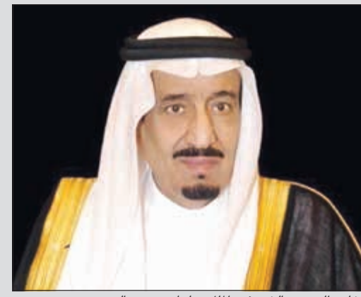
خادم الحرمين الشريفين الملك سلمان بن عبدالعزيز

خادم الحرمين مدشناً رئاسة المملكة لمجموعة الـ 20: سنسعي إبراز وجهات نظر الدول النامية